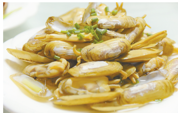
@Zenics: 等待一波开渔季，奉化莼湖小海鲜。——8月1日