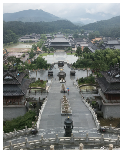
@sa小张张: 奉化雪窦寺 ——8月2日