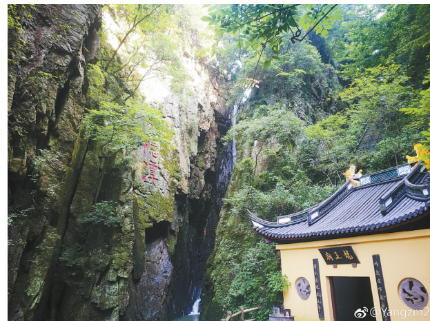
@Yangzm2: 浙江奉化——雪窦山三隐潭。——7月31日