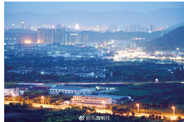
@九曲明月:醉美奉化。