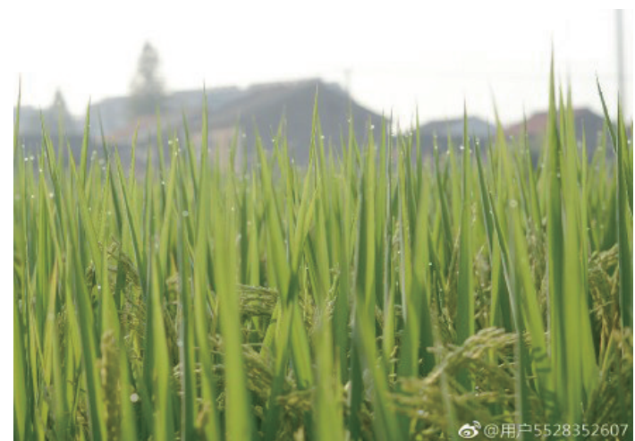
@杨小懒爱坚果:奉化方桥老村。