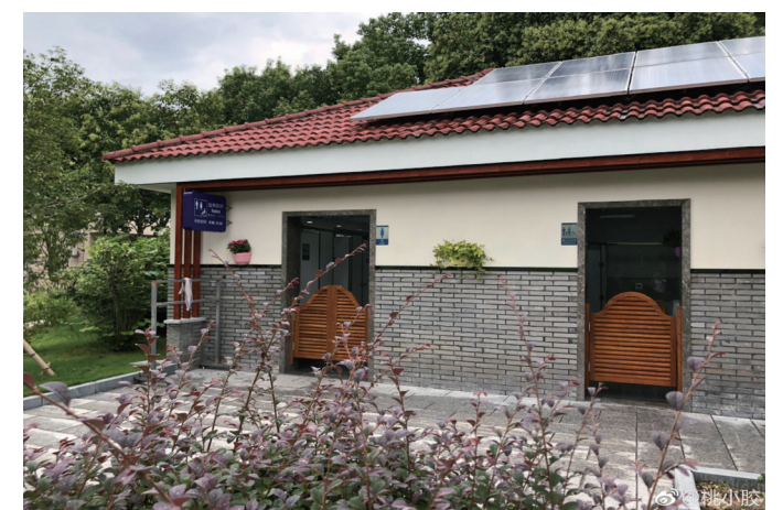
@桃小腔:锦山公园公厕设施改造得比较整洁。