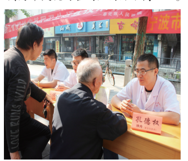
图为市民现场咨询如何防治高血压。

妇幼保健院、春晖社区居委会联合开展主题宣传活动。向居民们讲解精神卫生知识、免费量血压、发放宣传资料等。