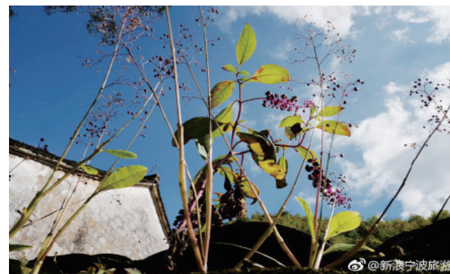
@新浪宁波旅游:奉化大堰镇村秋意盎然。