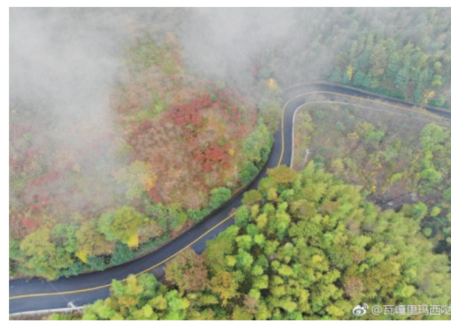
@瓦嘎里玛西哒:打卡奉化徐岩岩。