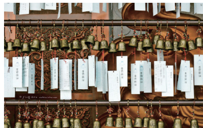
@卓越的思想者SISI:奉化雪窦寺。