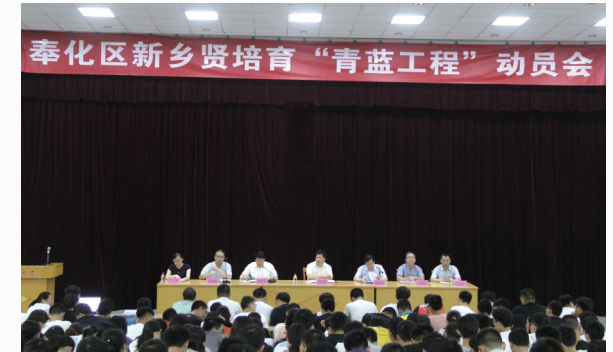
▲奉化区新乡贤培育“青蓝工程”动员会于今年6月在奉化中学举行，2018届奉化中学全体高中毕业生以及百名奉化高级中学、武岭中学、奉化二中、江口中学优秀毕业生代表参加。

“乡村振兴合伙人”计划，努力形成“政府主导、乡贤引领、企业助力、群众参与”的乡村振兴格局。目前，全区已有100余位企业界、学术界乡贤成功结对88个经济薄弱村，28个乡村振兴项目落地，146个村级乡贤阵地建成使用。