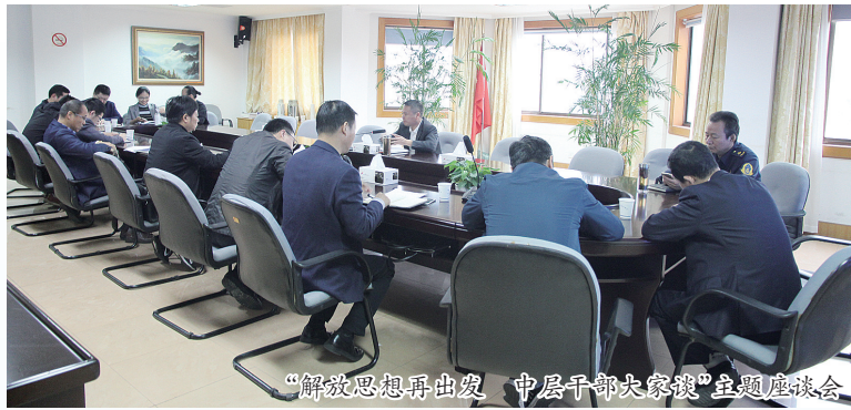
“解放思想再出发 中层干部大家谈”主题座谈会

区交通运输局局机关、区公路管理段相继开展以“解放思想再出发 中层干部大家谈”为主题的解放思想大讨论活动,中层干部们深入开展思想碰撞、精确查找思想问题,预防中梗阻,激发新动能,为下阶段交通运输各项发展提供新思路、新想法;区道路运输管理所开展“群众出题、运管来答题”活动,向道路运输企业、道路运输从业人员、广大群众广泛征集对我区道路运输工作的问题和建议并加以解答、整改,奋力实现道路运输行业高质量发展;系统各单位先后组织召开思想大解放活动动员会、专题民主生活会,