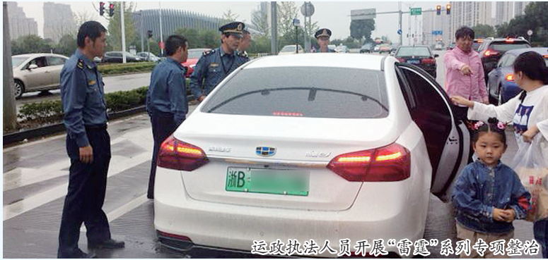
运政执法人员开展“雷霆”系列专项整治

以交通多领域行政执法力量为主要支撑,多线并进增强行业监管,严格落实安全监管机制,深化风险管控措施,坚决做好安全生产事故数量和死亡人数“双降”工作,今年截至目前,我区交通运输行业死亡事故起数和死亡人数较去年同期分别下降83%和86%,行业安全形势总体平稳。道路运输方面,以长途客运、旅游包车、城乡公交、山区公交和客运站等为重点,严厉打击超速、超员、疲劳驾驶、站外组客、不按规定下客、非法经营等违法违规行为,建立全区营运货车的安全监管平台,针对出租车、驾培、维修市场违法违规行为,目前已经查获各类违章案件502起;公路运行管理方面,严格依法治路,阳光执法,完成全区超限电子检测设备检定速度范围升级改造,到目前为止,组