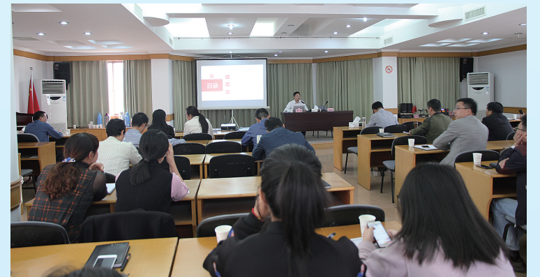
《中国共产党纪律处分条例》学习会

根据年初制定的干部学习计划,坚持每月至少1次的干部理论学习,结合主题党日活动组织召开10余次学习会,做到局领导上党课全覆盖,组织年轻干部进行工作经验交流,以讲促学、以学促进;多次邀请市委党校、区纪委专家针对交通发展新形势、法律法规及党风廉政党课等进行授课;组织全系统工作人员参与专题学习、座谈会、主题教育等活动,形成良好的学习和讨论氛围,进一步提高广大干部职工综合素质,提高思想认识。