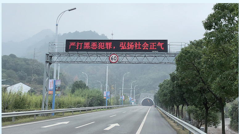
各线可变情报板发布“扫黑除恶”宣传标语

成功对溪口至宁波的直达班车实施了公交化改造,溪口至宁波的客运班线全部停运由公交线路代替,同时对溪口客运中心车站实施了人车分离,局部改造场站设施;优化公交线路规划,全面接轨宁波公交,开辟及优化多条区、跨区内公交线路;占地3万多平方米的莼湖公交站建成投用,成为连接奉化城区、莼湖、裘村、松岙及鄞州区的重要枢纽。积极开展奉化公交卡与宁波公交卡同票价同折扣以及一小时免费换乘等政策研究。