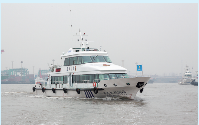
沿海港航管理执法艇投入执法序列

在2017年美丽航道建设的基础上,今年新增10公里美丽航道。促进奉化全域旅游建设发展,完成剡江、东江航道标志工程及零星清淤工程,积极推进剡江、东江专项疏浚工程,预计今年清淤54547方量。奉化沿海港航管理码头项目顺利完工,沿海港航管理执法艇投入执法序列,沿海港航管理工作拥有了更高的反应速率和更好的管理效率,进一步保障奉化港域水运的安全畅通。全面提升智慧港航建设水平,协助建成港口综合管理信息系统,完成全区港口企业电子信息数据库建设,基本实现内河主要航道和沿海主要码头信息化监控全覆盖。