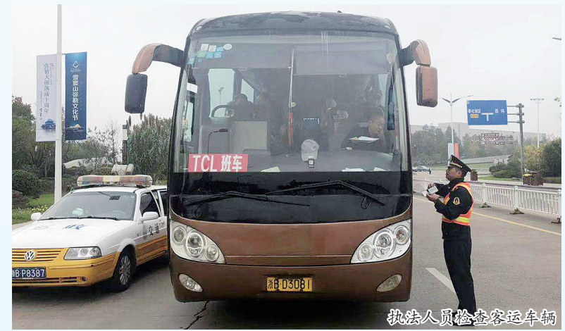
执法人员检查客运车辆

认真分析交通运输工作特点和难点,制订和完善运输安全保障工作方案和应急预案,成立突发事件应急处置领导小组,全面落实应急客运输车辆,做好运力调配和储备,及时通报信息,做好维稳安保工作。完成路网中心智能指挥平台升级改造和数字公路加密工程建设,到目前为止,全区监控节点已覆盖27条线路154个节点,基本实现全域重要路段和节点的“可视、可测、可控、可服务”。启动生命安全防护工程建设,组织开展公路隐患排查大排查、防汛安全大检查、施工安全专项检查,强化特殊时段交通保障,融合科技手段,以数字