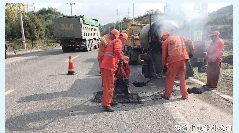
沿海中线修补坑洞

对照年度目标着力推进危桥改造、桥头跳车整治、公路大中修等专项工程建设,积极打造民生工程。目前共完成甬临线、尚界线、沿海中线等大中修工程25.028公里,江拔线、浒溪线预防性养护28.726公里,危桥改造7座,边坡整治10余处,“桥头跳车”问题桥梁治理35座。启动奉钱线白杜段路面大修工程、美丽经济交通走廊路面提升工程、县道边坡边沟整治工程以及县道3座危桥改造等项目,力争于年内开工建设。积极开展积水路段专项治理行动,到目前为止,已全面完成对甬临线、沿海中线等19个积水点专项整治任务。积极创建浒溪线(奉化段)省级精品示范路、金海线“最美公路”。截