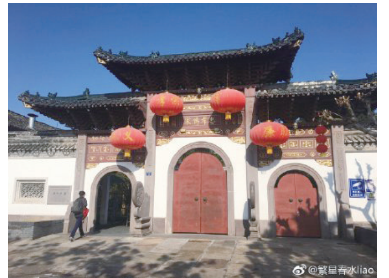
@繁星春水liao:蒋氏故里。 ——12月3日