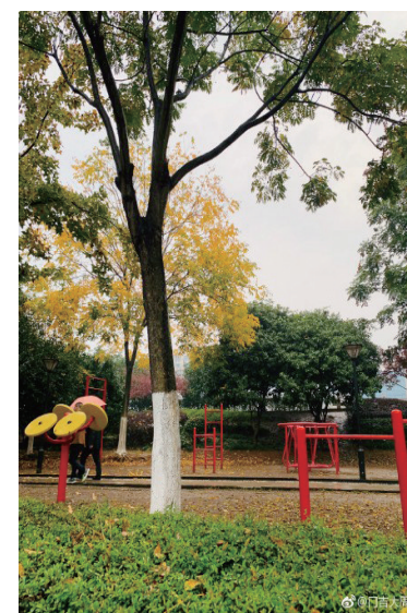
@门吉大周:醉美奉化,沿途秋色美不胜收。 ——12月2日