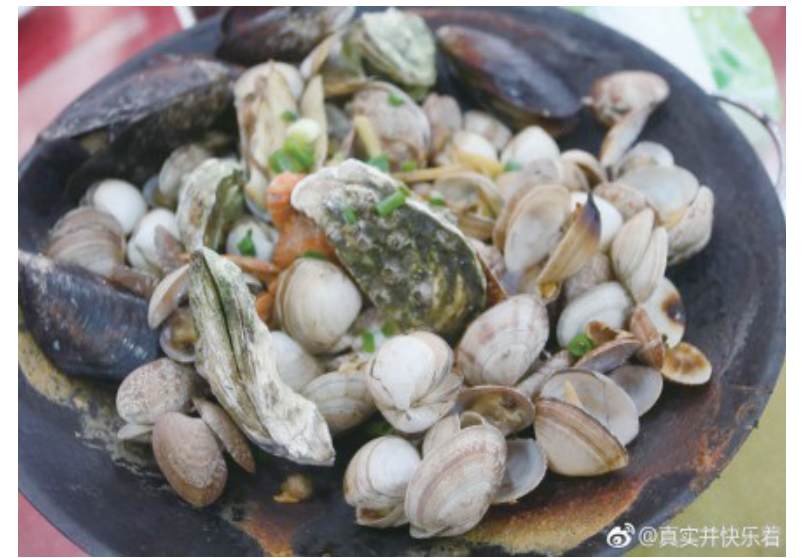
@真实并快乐着:奉化大排档的海鲜,味道好又便宜,惬意! ——12月2日