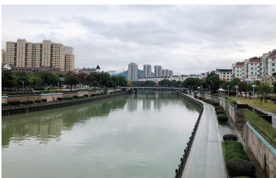
④王木木 he:大桥镇,曾是奉化城区的称谓。而地名的由来,与横跨在江上的惠政大桥有关。现县江两岸成了一道美丽的风景线。——12月12日