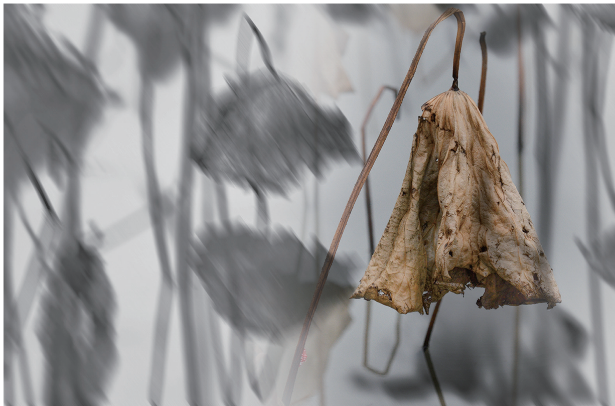
残荷墨韵