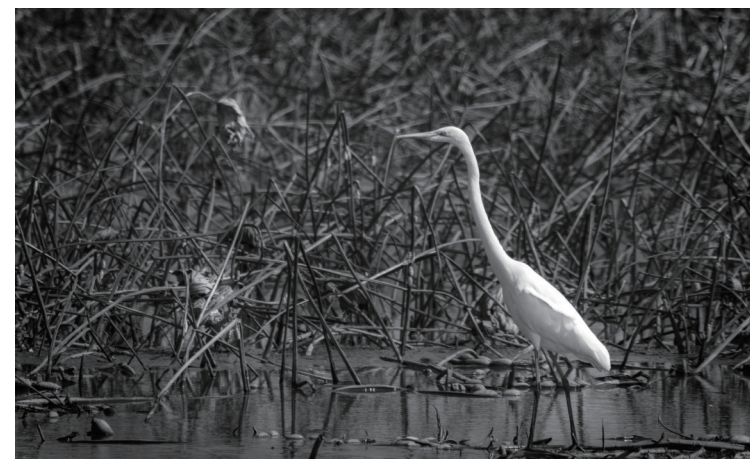
荷香依稀