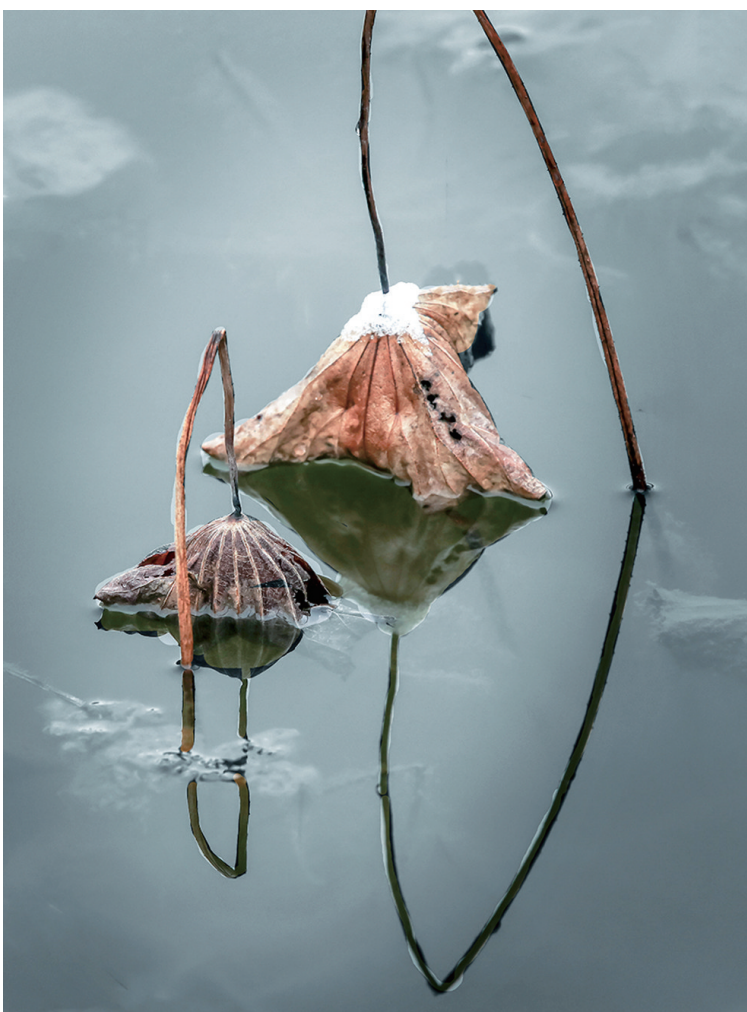
曾经翠叶