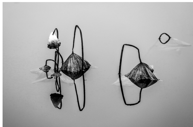
荷塘小趣