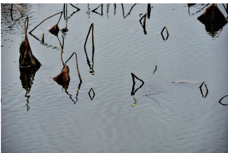
几何图形