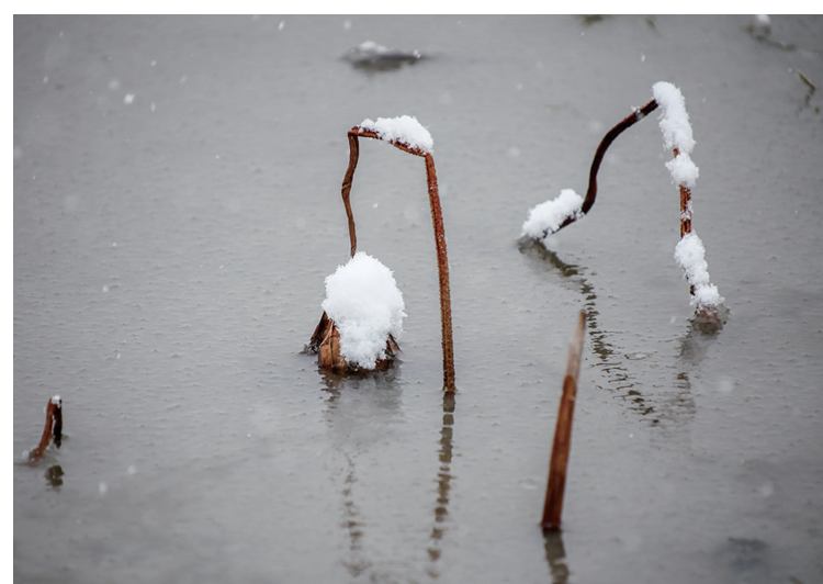
荷塘小雪