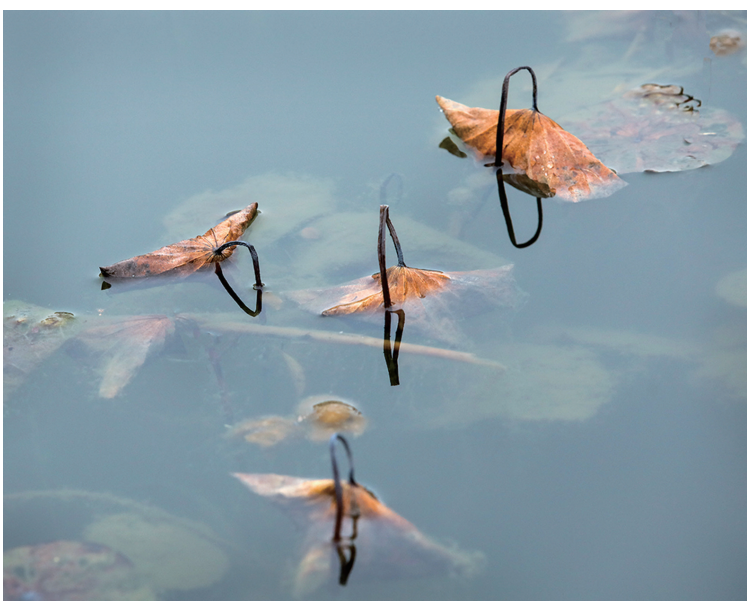
舞女的裙