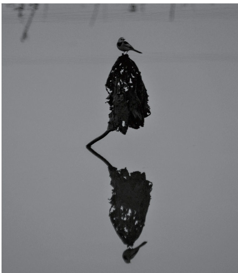
独立 王学佩 摄