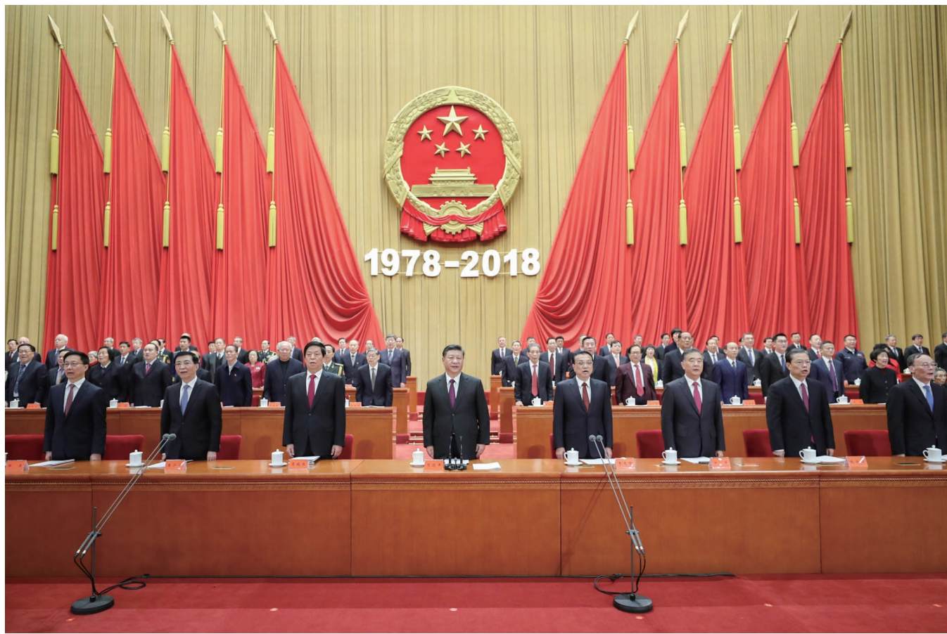
习近平、李克强、栗战书、汪洋、王沪宁、赵乐际、韩正、王岐山等出席大会。

庆祝改革开放40周年大会18日上午在北京人民大会堂隆重举行。中共中央总书记、国家主席、中央军委主席习近平在大会上发表重要讲话。