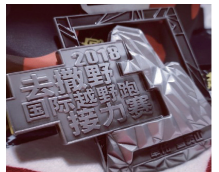
@Vicky_安宁: 撒野宁波奉化越野赛,真的完全的越野小白一枚。 ——12月17日