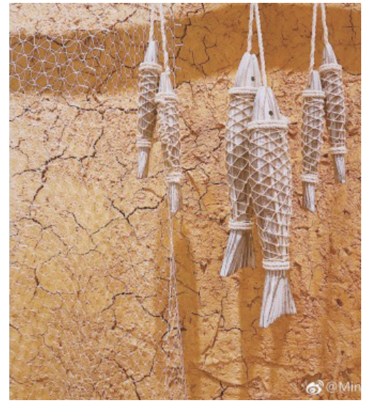
@MintraCong: 奉化裘村马头村,渔夫与海乡村音乐主题餐厅, 每去一次都有不一样的色彩。 ——12月16日