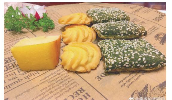
@童家的周糖糖: 奉化银凤度假村的住宿套餐。 ——12月16日