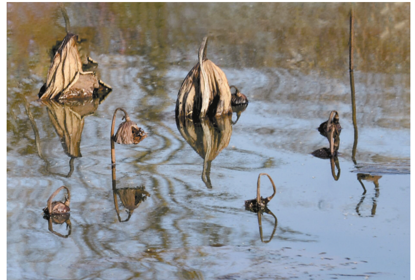
风韵依旧