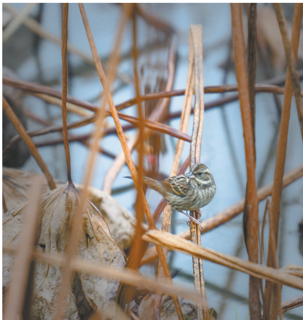
麻雀与残荷