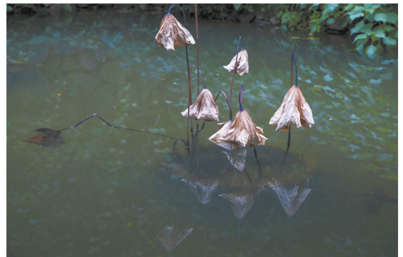
冬日一景