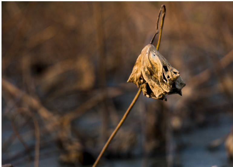
独树一帜