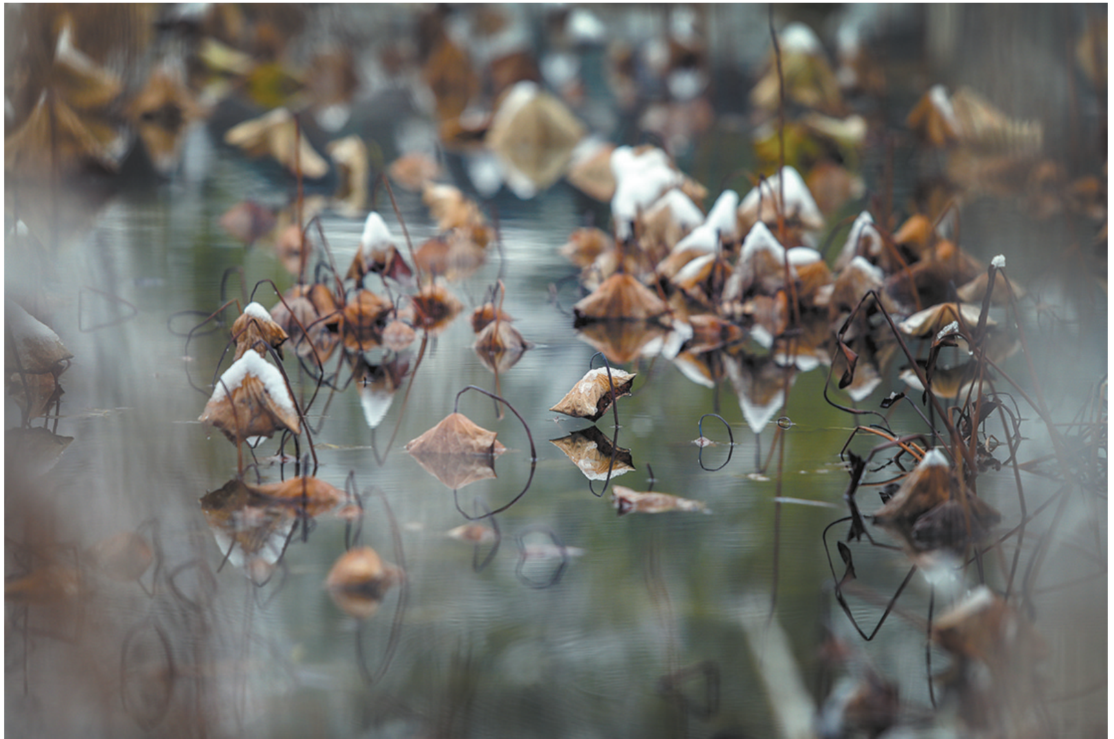
茵苔香消翠叶残

冬日已至,整肃藕池,但是岳林街道斯张村、江口街道麦浪农场、西坞街道茗杨村的多亩荷塘,依旧静待着游客一访,以探冬荷之意境!