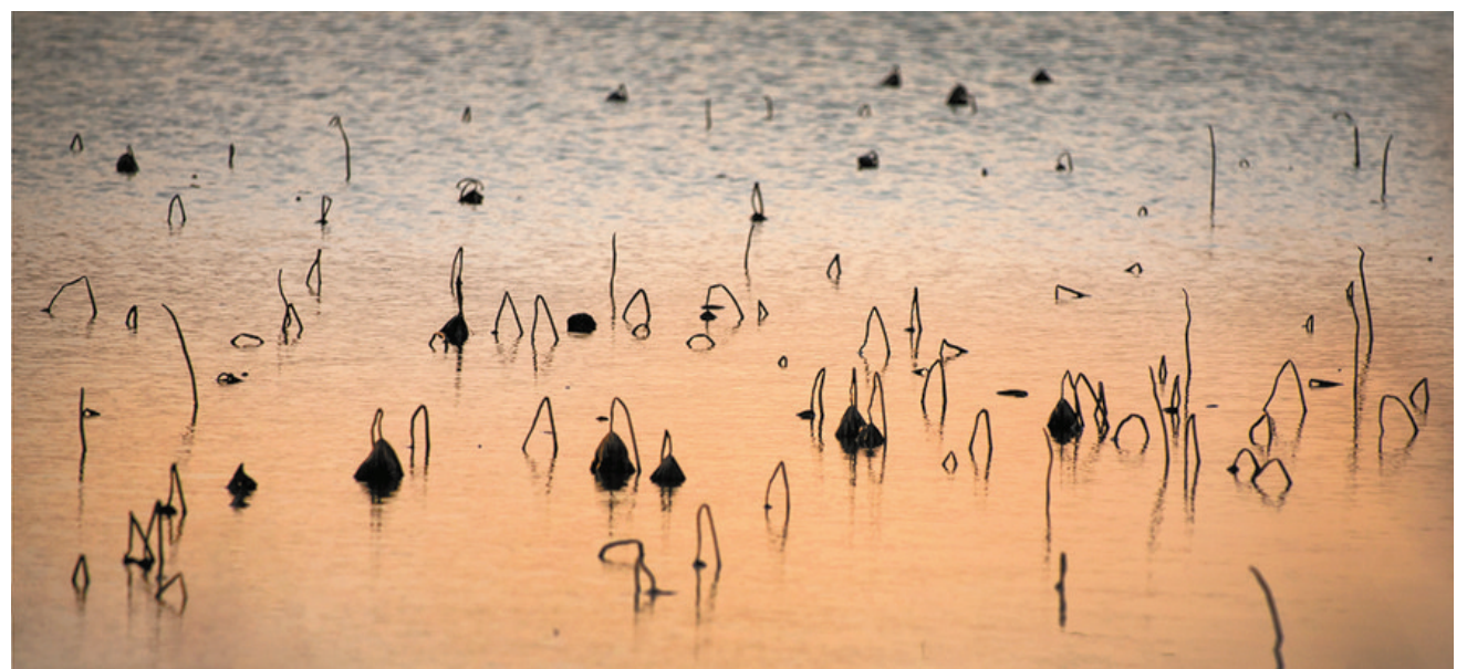
一抹夕阳抚残荷