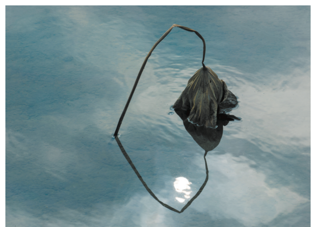
心中的太阳