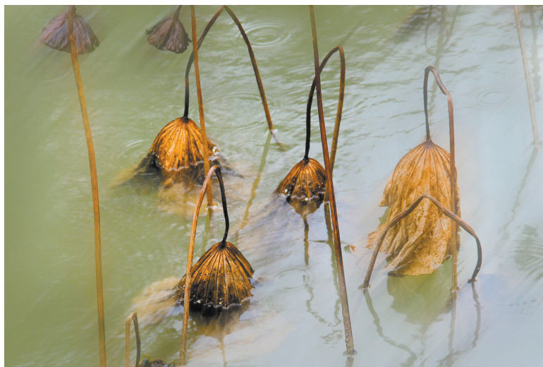
雨抚残荷