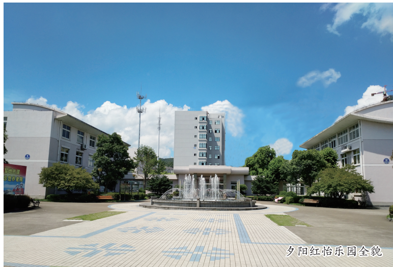
夕阳红怡乐园全景