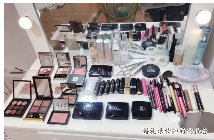
婚礼跟妆师的化妆台