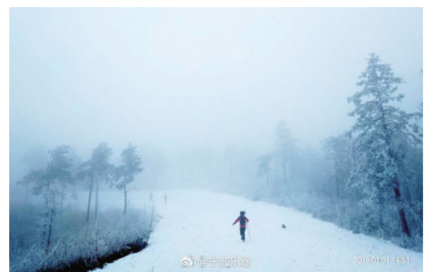
@宁波乐途:不用去东北啦!奉化商量岗,大山深处,还有这么多积雪。