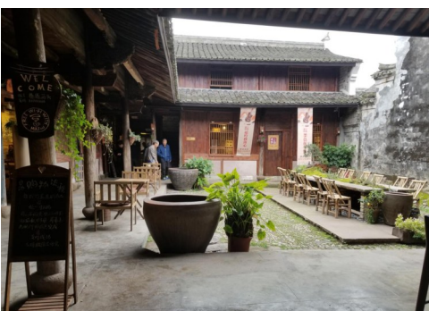
▲图为马头村“巷遇马头”乡旅文创中心一角。