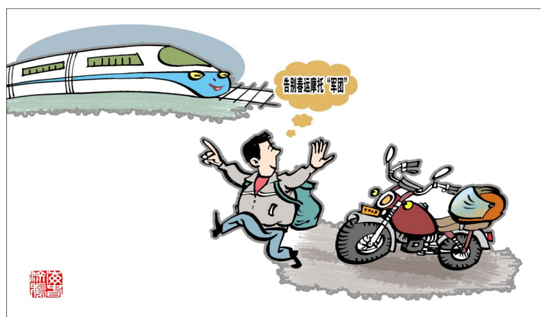
告别春运摩托“军团”