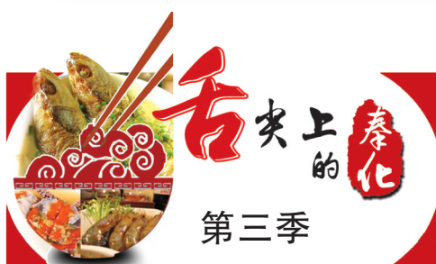
宁波佐餐王调味食品有限公司协办