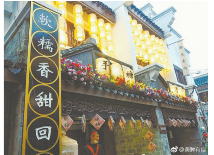
@美眸有痣: 奉化网红地打卡。从此不问南塘是何处?更有西安美食排排,给吃货安排。 ——2月19日