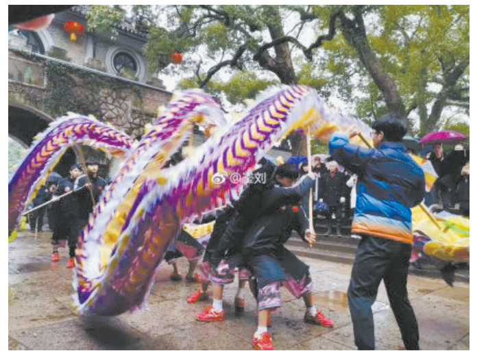
@崧刘: 非物质文化遗产——奉化布龙。 ——2月19日