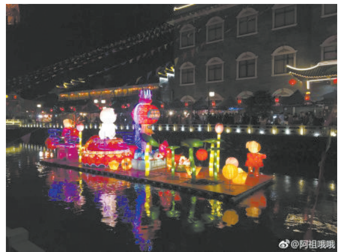
@阿祖哦哦: 半月来第一次停雨,元宵节特地去了逛了庙会,到了萧王庙,品了奉化特色小吃。 ——2月19日