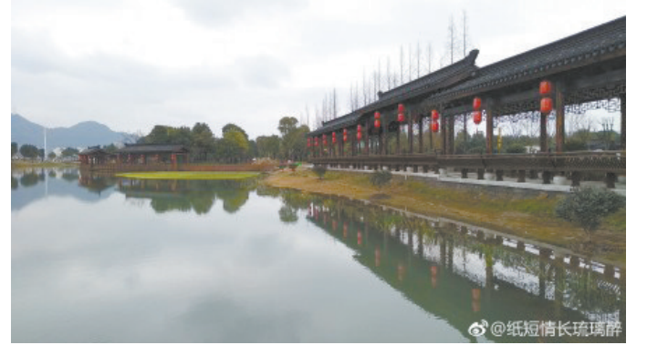
@纸短情长琉璃醉: 奉化滕头。 ——2月18日