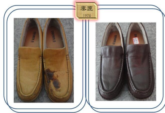
皮鞋修护前后对比