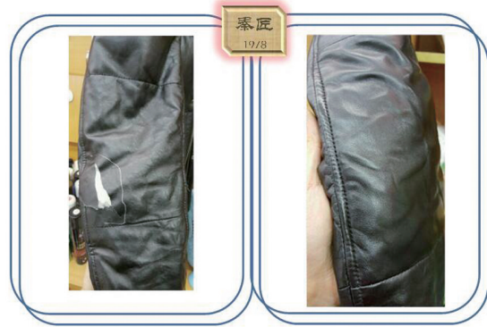
皮衣修护前后对比