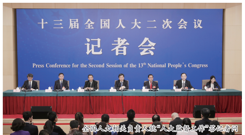
全国人大相关负责人就“人大监督工作”答记者问