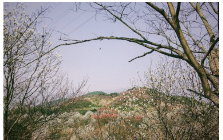
@突突突突突: 奉化一日游。