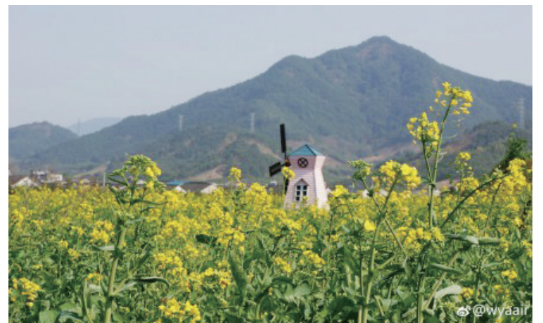
@wyaair: 溪口新建村油菜花。