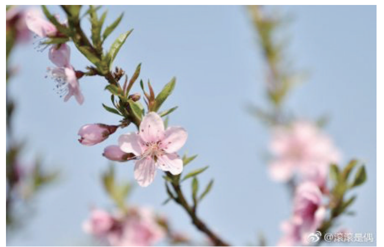
@滚滚是偶: 部分桃花已经开始吐露芬芳,2019奉化海峡两岸桃花马拉松期间桃花将开满奉城。