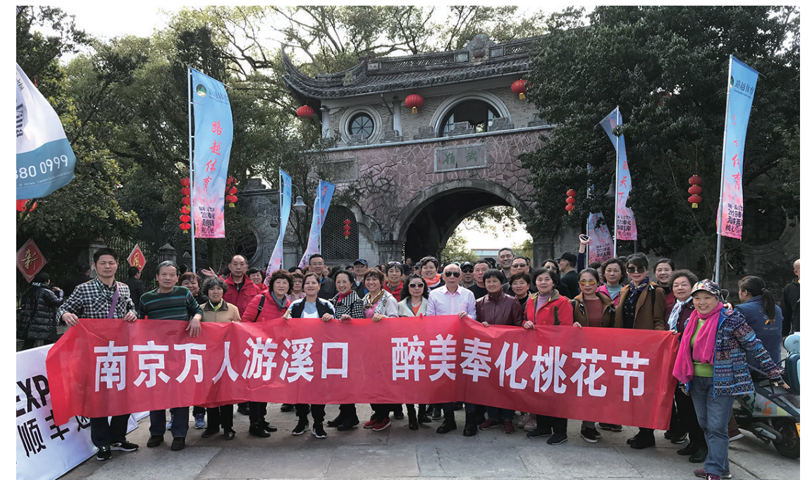
游客在武陵门合影留念

据了解,3月以来,溪口景区陆续迎来南京、苏州、上海、温州、台州等城市的万人游客大团,由温州中山国旅、南京时尚、江苏笨鸟等一批知名旅行社组团而来的游客,将纵游雪窦山水,尽享浪漫花海,开启了一段令人难忘的春日之旅。