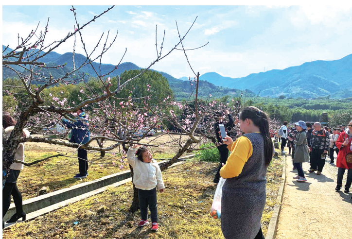
游客在新建赏桃花

桃花开了来溪口,十里花海等您看。在这绝佳的赏花踏青时节,当游客们来到“民国文化第一镇”溪口镇、“中国佛教五大名山”雪窦山,白天可游走于雪窦山水之间,随性欣赏这里的旖旎春光,朝拜露天弥勒大佛,尽享幸福快车体验穿越峡谷的惬意,感受浙东春天的气息。晚上则可“夜游”蒋氏故居,漫步三里长街,感受别样的溪口民国文化和往昔风情。生活与工作总有太多的忙碌,但偶尔也需要停下脚步,给自己一个放松心灵的机会。那么,您和您的家人朋友们,带上美丽的心情,且勿辜负了这大好春光,开启这一场与溪口盛景的灿烂约会吧!