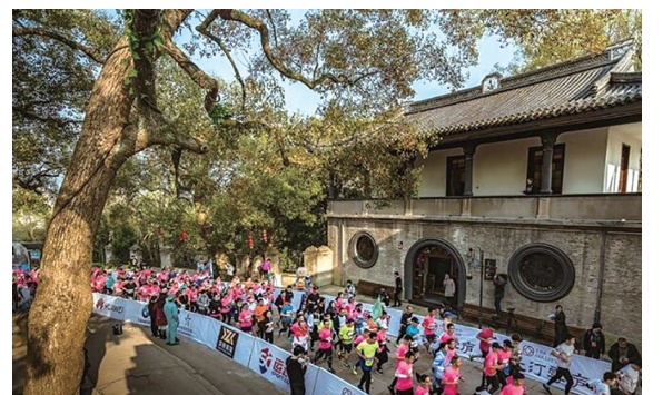
2019中国奉化海峡两岸桃花马拉松赛