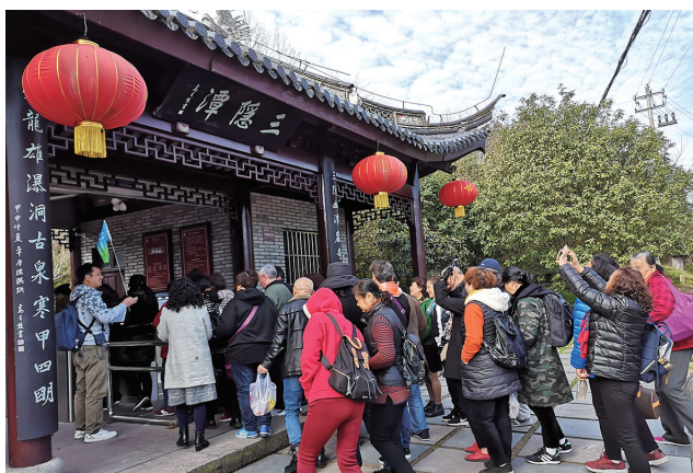
游客在三隐潭游玩

三四月之交的盛春,溪口十里桃花盛开,成为游客踏青的大好时节。3月20日,2019奉化水蜜桃文化节在“天下第一桃园”主会场启幕。为助力奉化这个重大节庆活动,当天,溪口景区组织到的长三角五大城市首批千名游客,赶赴桃花美食之约,源源涌入溪口,标志着“万人大团赏花战役”正式打响!