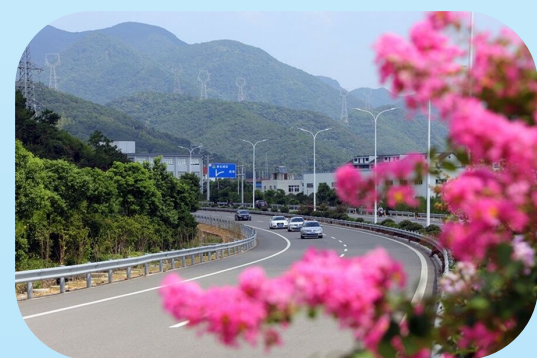
金海线四季花香文明风景线