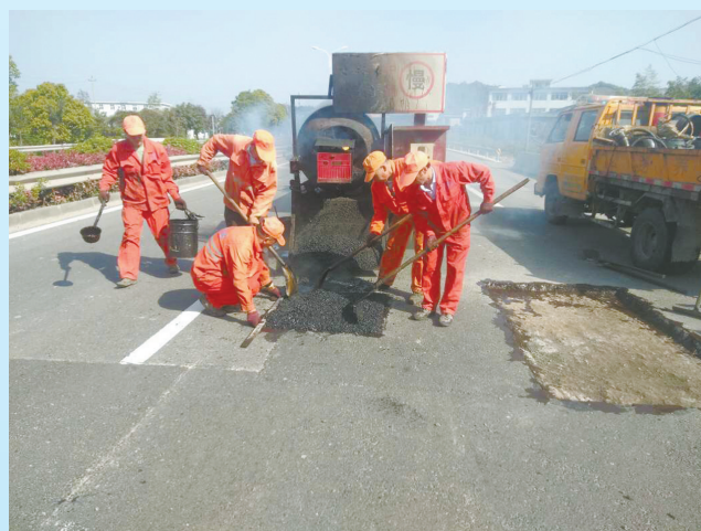
甬临线修补路面坑洞