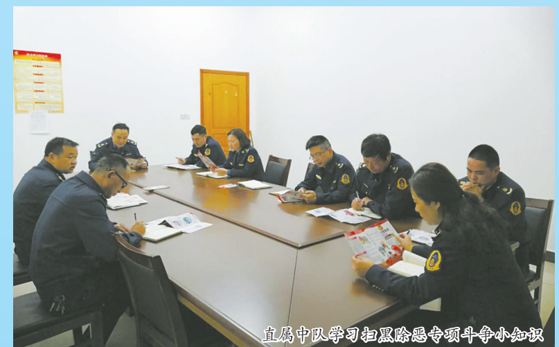
直属中队学习扫黑除恶专项斗争小知识

引导，做好法律政策宣传工作。路政执法人员对公路沿线建材企业、砂石料厂、在建涉路施工单位等开展扫黑除恶专项斗争源头宣传，向公路沿线群众发放扫黑除恶专项斗争宣传传单、公开举报电话，畅通信息渠道。