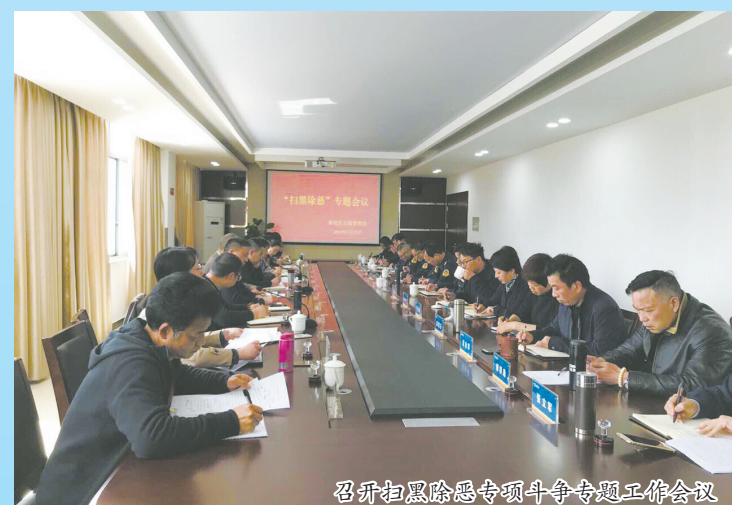
召开扫黑除恶专项斗争专题会议