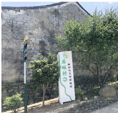
“菜单式”预约和服务对象建档跟踪等志愿服务行动举措。

据悉,自去年整合10余支志愿服务队,成立大堰镇连山公益空间联盟后,该镇实现了志愿服务“枢纽站”全覆盖,创新推行志愿者管理网络化、志愿服务