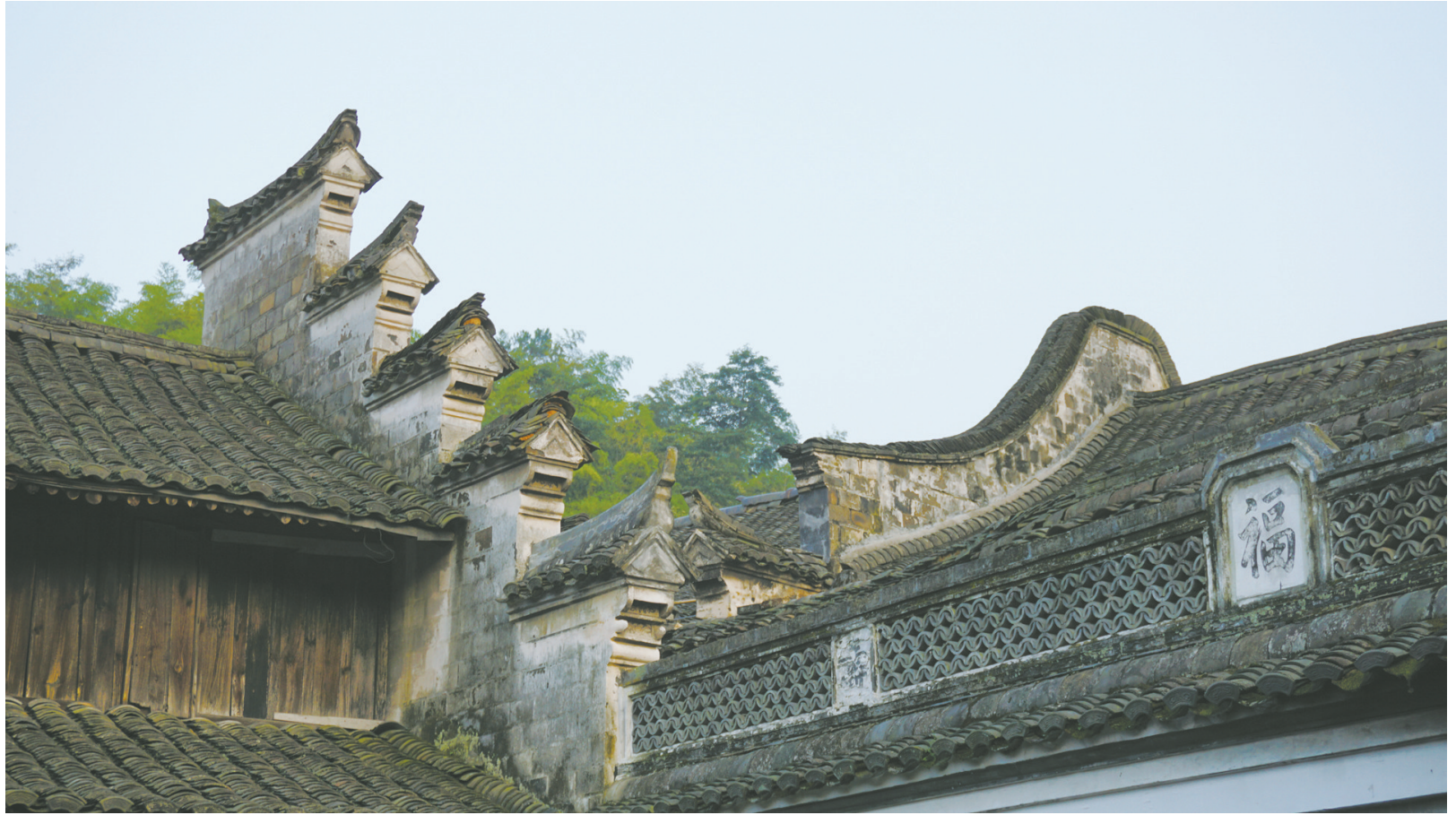
“五马”“观音兜”各呈其妙