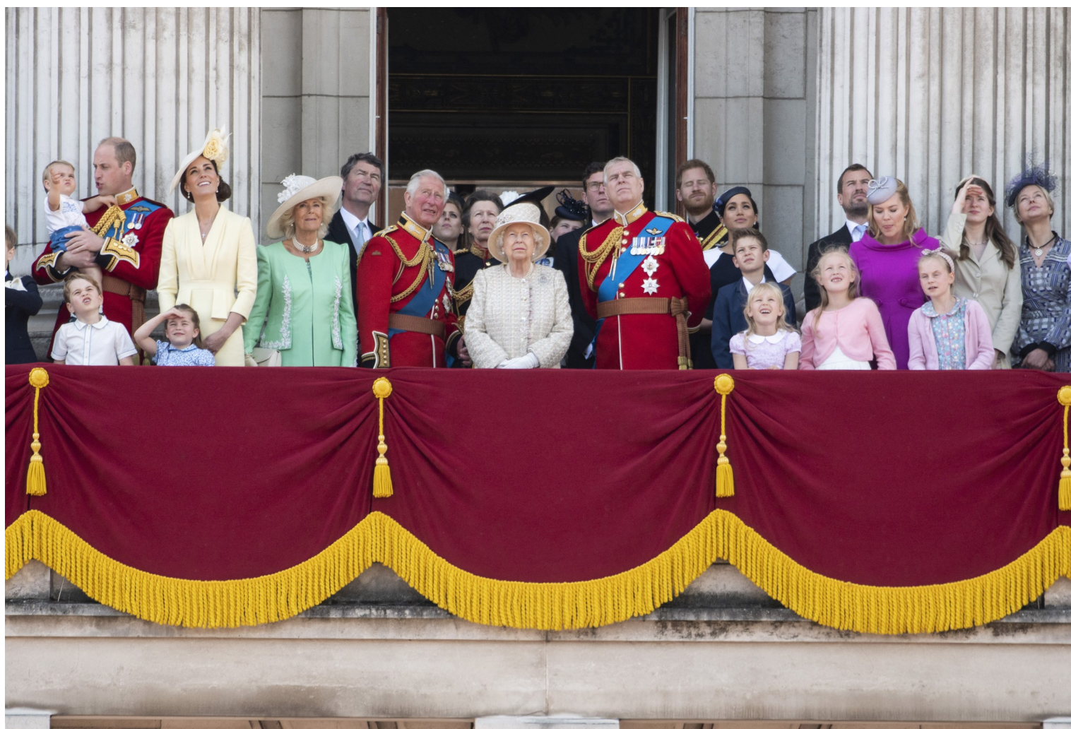
6月8日,在英国伦敦,英女王伊丽莎白二世(中)和王室成员在白金汉宫阳台上庆祝女王生日。当日,英国伦敦举行盛大庆典,庆祝英女王93岁官方生日。