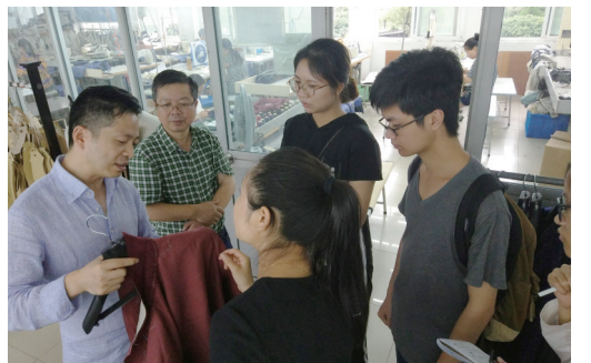
浙江大学团队听服装企业负责人介绍衣服特点

出可以形成一条民国建筑人文旅游线路,使奉化乡村振兴成果与区域旅游紧密契合,互相推动;其次,可以实行区域“一带一路”,以先进村带弱村,从而实现乡村振兴之路;最后,青年要当好先行者。