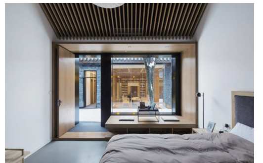
浙大团队设计的民宿效果图

为了使马头村的特色更明显,设计中加入马头墙和“屋脊鸱吻”的元素。此外,整条街道在保留原有古村建筑特色的基础上,适应时代发展,特色徽式建筑中注入现代元素,有助于促进当地旅游业的发展。