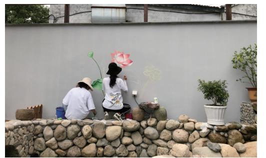
宁波财经学院学生在桐蕉司村墙绘

电线的小男孩”“浇水的老爷爷”,还有关于绿色出行垃圾分类的墙绘。“现在我们刚进行到一半,组员们对此活动抱有极大的激情,虽然工作量很大,但却是我们暑假里难忘的回忆。”宁波财经学院环境设计专业一学生这样说。