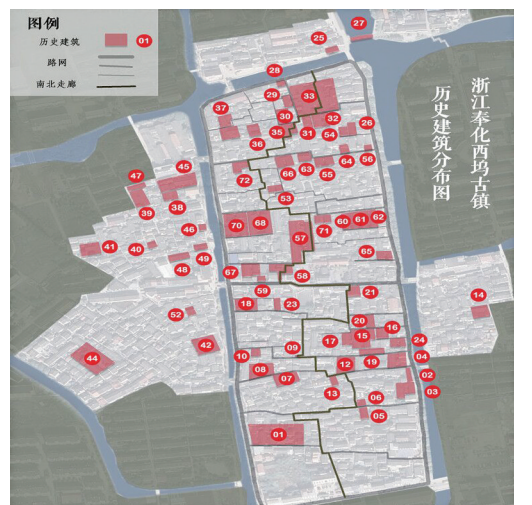
据经纬调研的西坞历史建筑

踞经纬说:“作为一个本科生,我不奢求能做出卓越的成绩,只希望能发挥专业优势,从小方面有所突破,为当地旅游开发做参考,并让西坞文化更好地流传。”