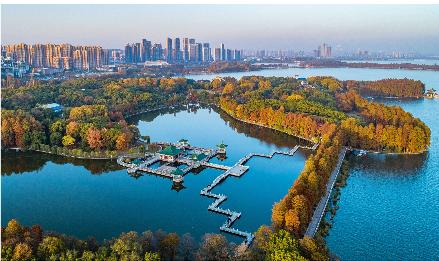
湖北省武汉市东湖绿道(2018年11月23日无人机拍摄)。

生态文明建设,是关系中华民族永续发展的根本大计。七十年来,山水林田湖草,祖国山川生机盎然,一幅幅壮美的生态发展画卷徐徐展开。