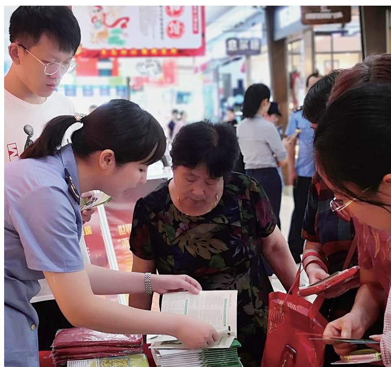
区市场监管局干部在大润发超市内开展2019年质量月宣传活动。

据了解,近年来,我区积极参与浙江制造标准制订并不断取得突破。从2016年开始至今,我区已累计发布“浙江制造”标准11项,今年计划制定5项标准,其中宁波吴鑫裕隆新材料有限公司制定的《水相法氯化橡胶树脂》标准已成功发布,宁波协诚电动工具有限公司制定的《手持式电动高枝剪》标准已进入研讨完善阶段。