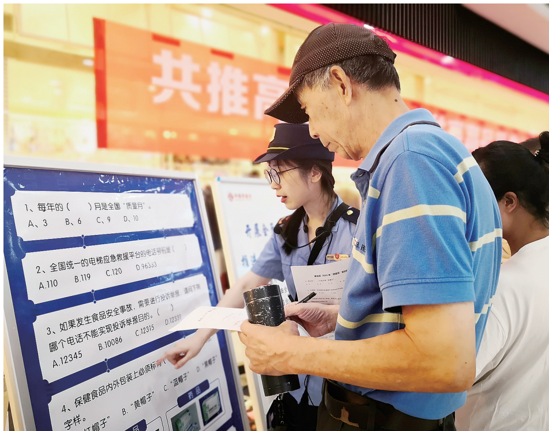
区市场监管局干部在质量月活动现场向群众普及相关知识。

9月来临,我区已举办或将举办更多质量月相关活动,希望人人关注质量月,重视质量,提高质量。