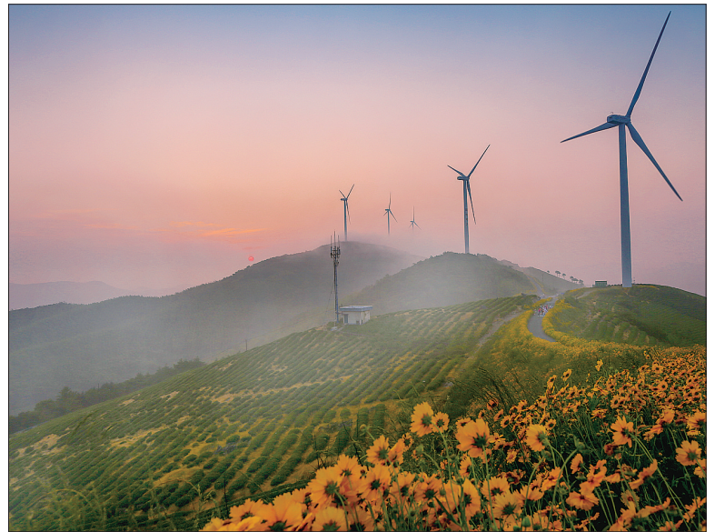
白岩山风光