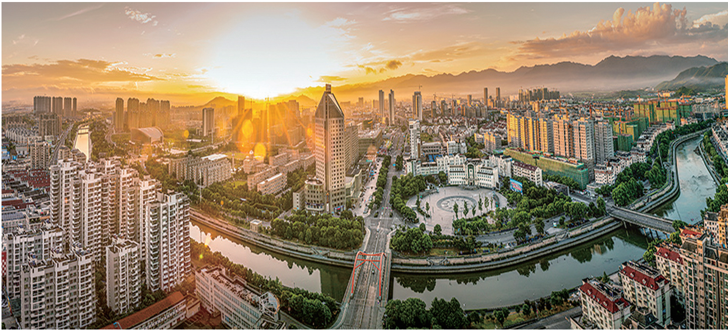
岳林广场全景