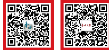
奉化发布 奉化日报