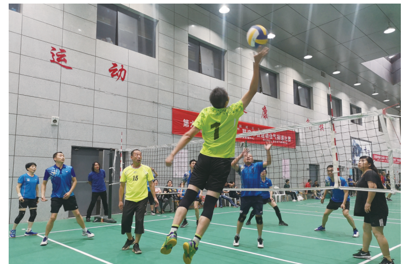
奉化日报联谊会第六届运动会气排球比赛昨天结束,14支球队经过分组循环赛和淘汰赛两轮角逐,决出前8名。其中奉化供电公司队、区人民医院队、区民政局队分获前三名。