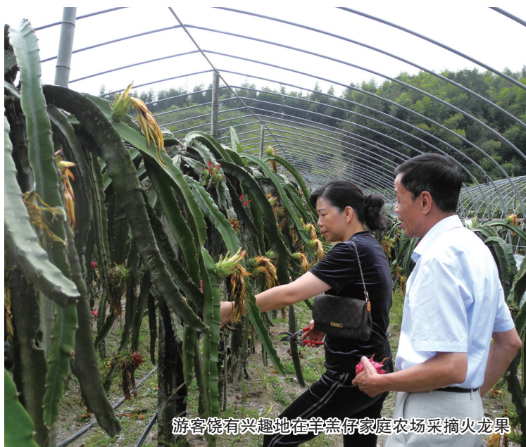
游客饶有兴趣地在羊羔仔家庭农场采摘火龙果

金秋时节，记者来到西坞街道税务场村，映入眼帘的是，农村住房改造热火朝天，一排排新房拔地而起，村民的脸上个个写满笑意。这是区农业农村局按下农村住房改造“快速键”出现的可喜景象。