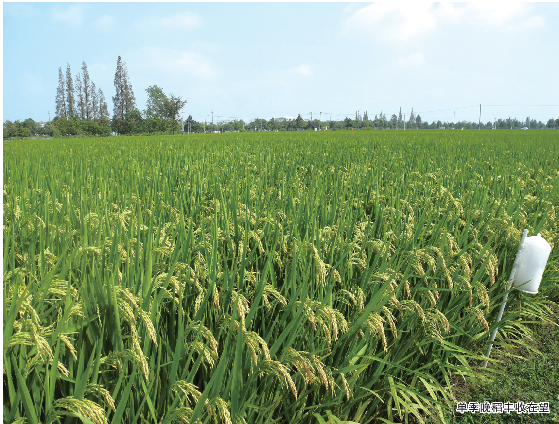
单季晚稻丰收在望