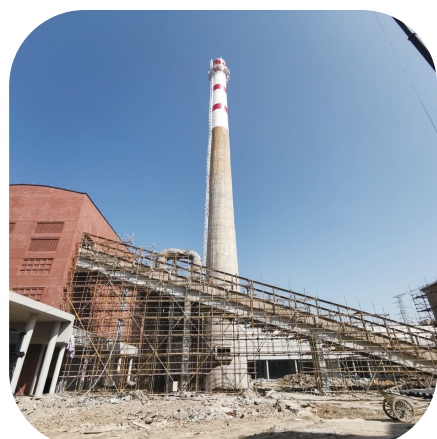
建设中的奉化博物馆

时代变迁,热电厂冷却关停,博物馆拔地而起。这座建于上世纪80年代的热电厂曾是奉化当地工业的象征,高耸的烟囱,巨大的厂房框架……种种迹象表明着电厂当年的辉煌。如今,数只倾倒煤炭的煤斗依旧将自己庞大的身姿展露在世人面前,不曾遮掩,只是放料口装上了LED显示屏。当你坐在下方的座椅上,桃花光影从天而降,告诉你“在那桃花盛开的地方”的故事。