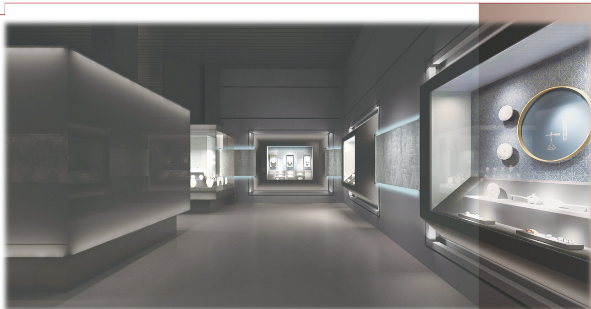
山海交响—奉化历史文明厅效果图