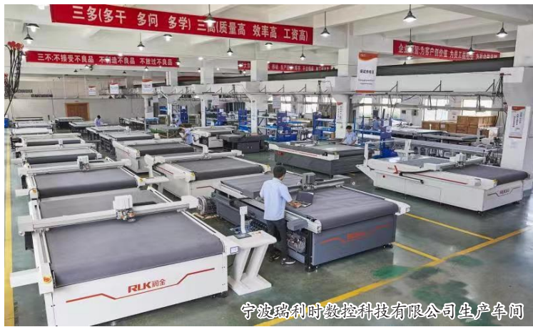
宁波瑞利时数控科技有限公司生产车间

倍,同时可节约10-20%的材料。这成功改进了传统服装企业纯手工裁剪方式,为服装企业客户提供计算机排版、计算机自动排料及整体自动化裁剪方案,大大减少了服装企业手工裁剪的人力成本,材料浪费成本,质量成本,解决了企业用工短缺的问题,特别是对于小批量、个性化定制的单量单裁,该切割系统对接互联网定制平台呈现了完美的裁剪效果、裁剪效率。 宁波瑞利时数控科技有限公司相关负责人表示,自动化切割行业市场前景非常大,小批量生产和个性化定制正逐渐成为行业的主流,如何快速提高生产效率和缩短生产周期是当前很多企业面临的难题,为此,该公司将秉承同心图治,求实创新的精神,为客户持续创造最大价值。目前,公司已经建立了覆盖德国、法国、意大利、俄罗斯、澳大利亚等20多个国家和国内40多个城市和销售网络,产品受到了艾莱依、波司登、爱伊美等知名品牌的好评。2018年2月,该公司还被浙江省服装创新服务综合体-秋意浓共享智慧工厂产业园授予战略服务商。