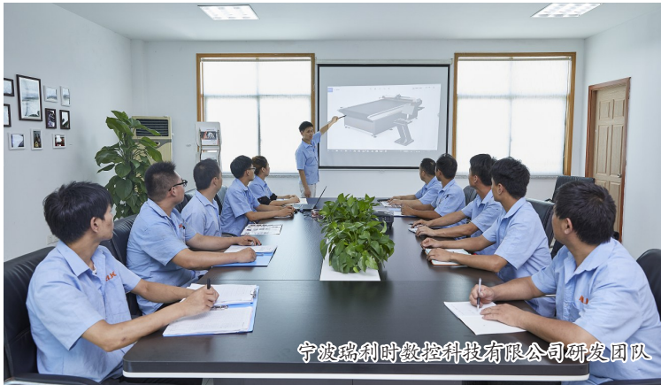
宁波瑞利时数控科技有限公司研发团队