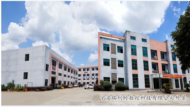
宁波瑞利时数控科技有限公司外景