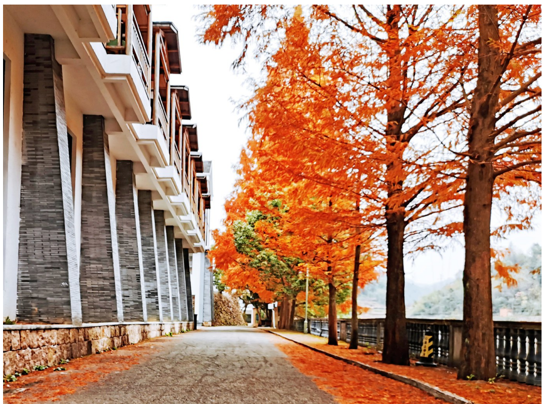
在甬江源附近拍摄的红枫。