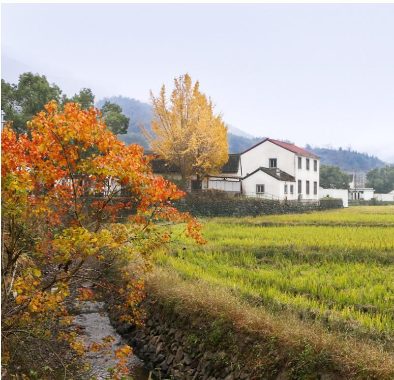
在沙窰村拍摄的如画美景。