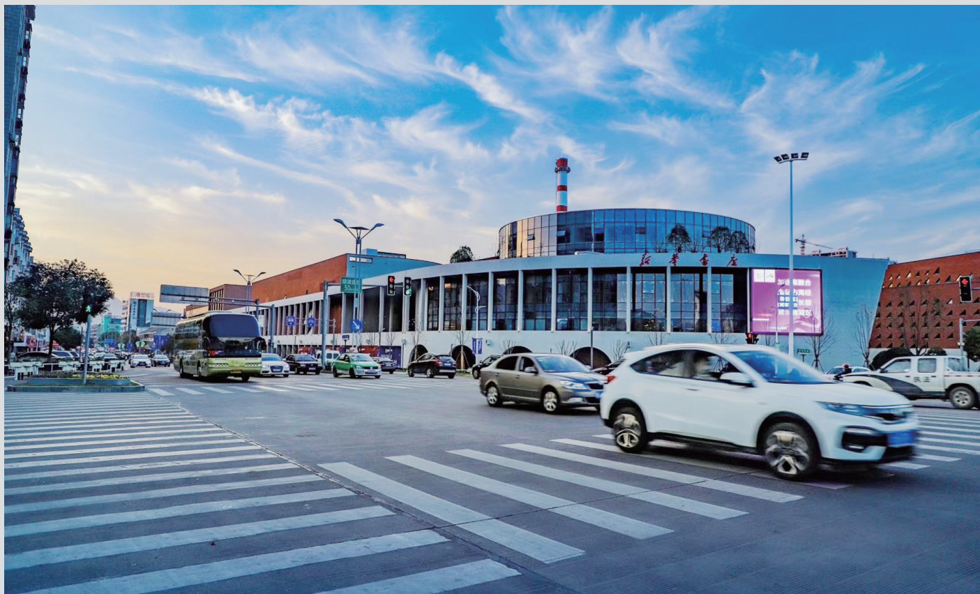
城市文化新地标

笔者认为,能够让人才实现价值的城市更具吸引力,而人才也是城市发展的动力之源,留住人才必须多管齐下,政府部门必须各负其责、齐心协力,才能为城市发展提供源源不断的动力与生命力。