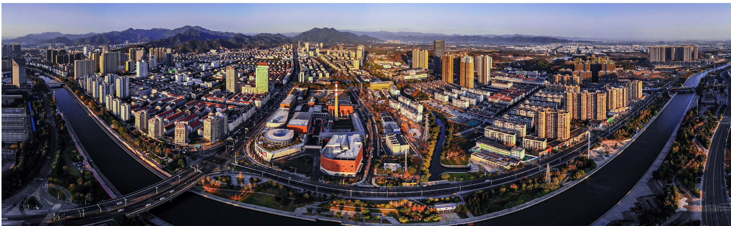
城市文化广场航拍图