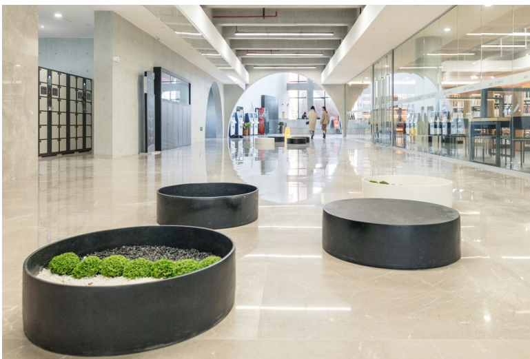
区图书馆二楼一角