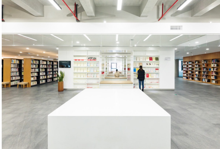
中间可透视的书架