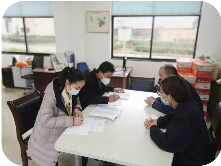
现场评估小组八组对锐泰公司复工申请进行实地审核评估