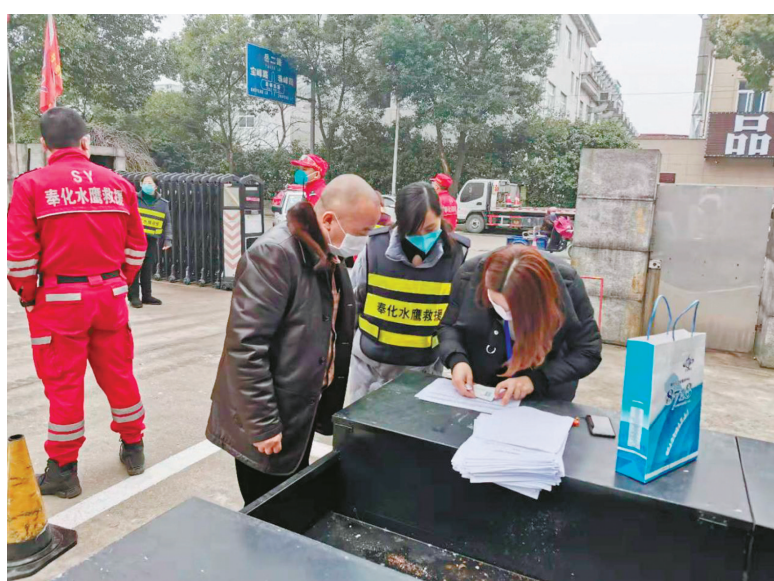
企业派代表分批领取消毒液

考虑到疫情的实际情况,区企服中心决定统一组织配送。为避免人员聚集,8718奉化平台逐一联系企业相关负责人分批前来领取。2月4日中午12时开始,区企服中心、企服专班及岳林街道有关人员持续忙碌,耐心向每一家企业分发使用须知,讲解产品使用方法,反复强调安全使用有关事宜。至晚上7时,12.28吨消毒用品全部发放完