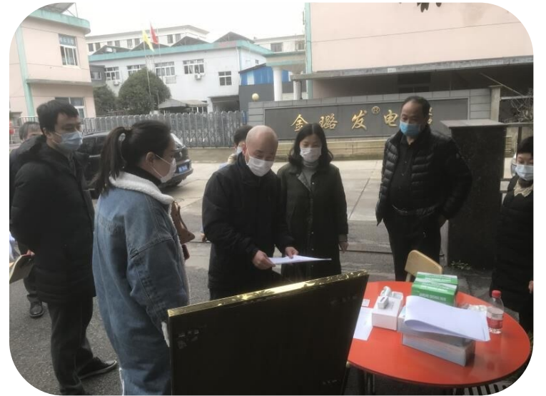
现场评估小组一组走访复工申请企业