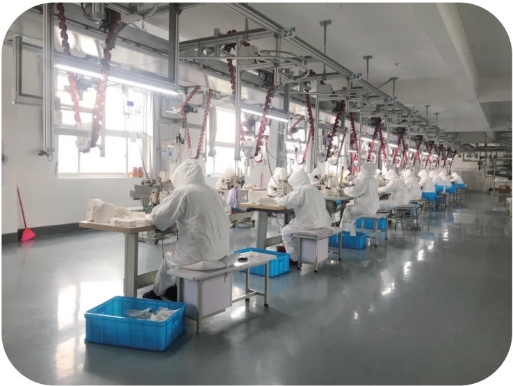
博洋家纺集团奉化分公司“跨界”转产口罩

新型冠状病毒肺炎疫情发生后,举国上下共同抗击疫情,区经信局坚决贯彻落实中央和省、市、区决策部署,抓住关键、周密部署,立足主责、精准施策,全员坚守岗位,坚持做好应急物资生产组织调度和工业企业复工复产牵头指导服务“两手抓”,坚决打赢打好疫情防控阻击战和发展总体战。