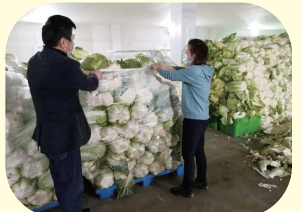
凌晨公司员工搬运蔬菜供应市场