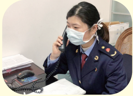
市场监管局青年接听热线解决难题

为响应上级团组织“一手抓有力防控，一手抓有序复工”“两手都要硬，两战都要赢”号召，奉化团区委积极开展战“疫”青春合伙人计划，迅速组建青年突击队28支，涵盖团员青年1300余人，广泛动员团员青年积极助力企业复工复产，为打赢疫情防控阻击战贡献青春力量。