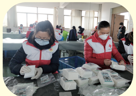
志愿者助力企业生产