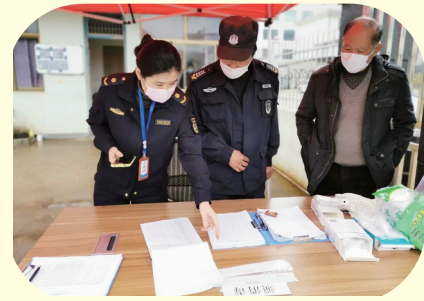
综合行政执法局青年走访企业