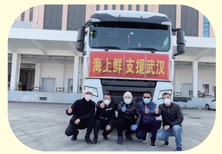
海鲜鲜向武汉捐赠物资