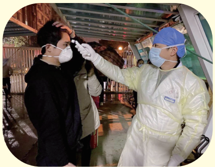
江口街道青年干部助力企业复工返岗