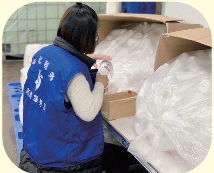
税务青年临时顶岗进车间