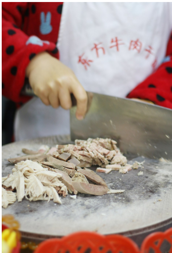
东方牛肉干面店厨师在切牛肉