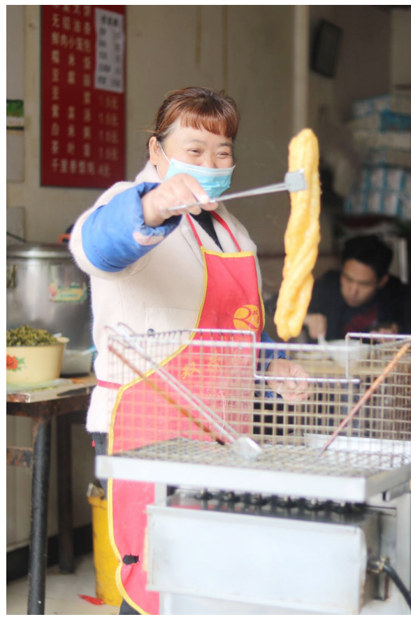
安心油条店刚出锅的酥香油条