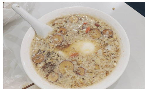
又一村小店的“核桃蛋”