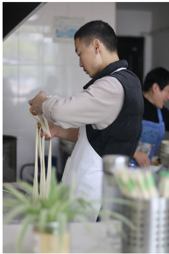
东安面馆厨师在做拉皮