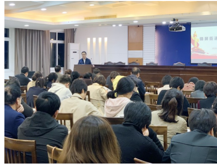
健康美丽新城区建设提供强大的思想保障和智力支持。

该街道切实响应市、区两级关于建立“周二夜学”制度的通知精神,建立常态化“周二夜学”制度,力促“大学习大调研大抓落实”活动深入开展。采用定期集中学、轮流展示学、主题论坛学、个人自学学等多种形式,既“向外学”,邀请专家学者举办讲座,学习党建、城市建设、数字经济、创新创业、生态文明建设、文化历史、乡村振兴等理论和实践知识,又“向内学”,学习先进典型、身边榜样,提升机关全体干部职工的能力水平,努力培养一支想干事、能干事、会干事的锦屏铁军队伍,为扎实推进现代化