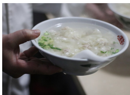
状元坊馄饨店的馄饨