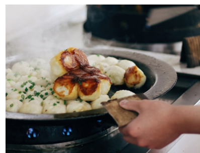
小江生煎店的生煎包子