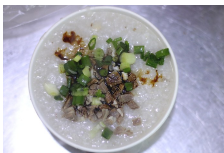
阿军羊肉馆的骨头粥