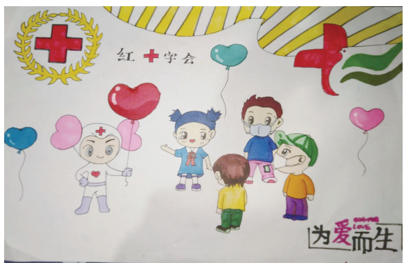
南浦小学401班小记者 杨馨 指导老师 周冰姿