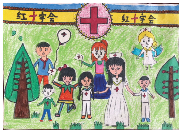
南浦小学401班小记者 田梦宇 指导老师 周冰姿