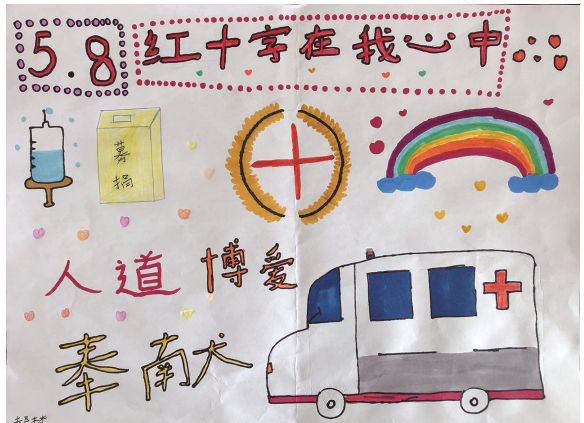
南浦小学501班小记者 郝梦 指导老师 毛亚