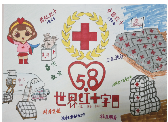
南浦小学203班小记者 张振宏 指导老师 卓赛余