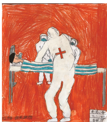
南浦小学501班小记者 李凯宁 指导老师 毛亚