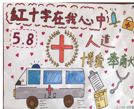
南浦小学501班小记者 郭茵蔓 指导老师 毛亚