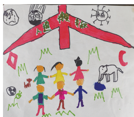
南浦小学403班小记者 朱岩烁 指导老师 章蓉娟