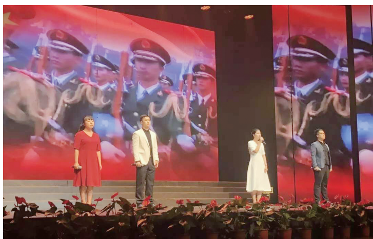
庆祝新中国成立70周年文艺汇演