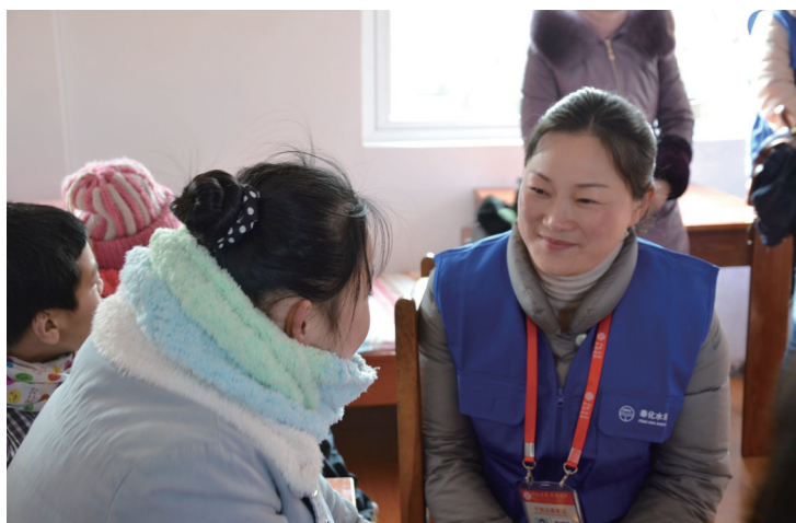
水晶服务队队员看望孤儿