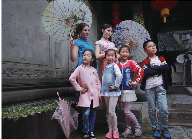
学做小模特