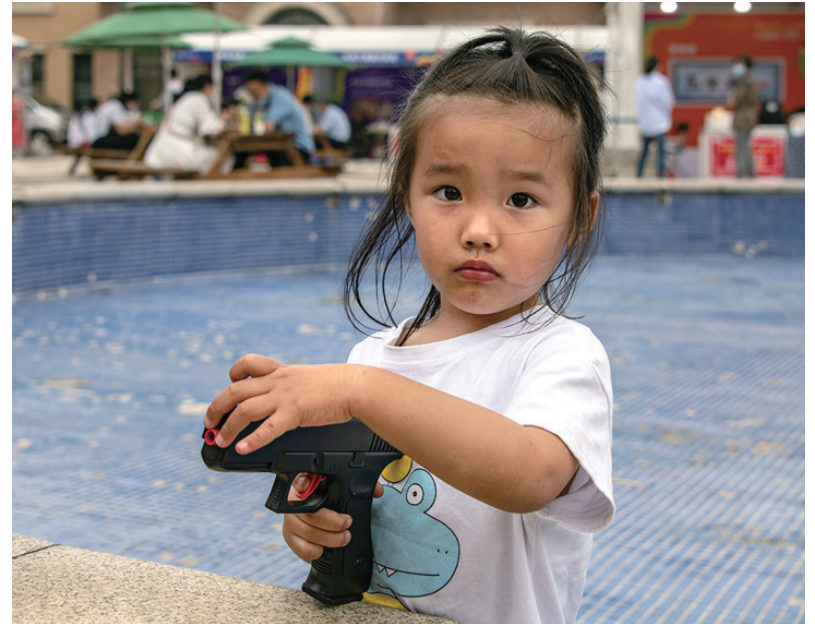
不爱红装爱武装

六月,是播撒希望的季节,是歌声飞扬的季节。在“六一”国际儿童节来临之际,祝愿孩子们健康、快乐、幸福地成长。