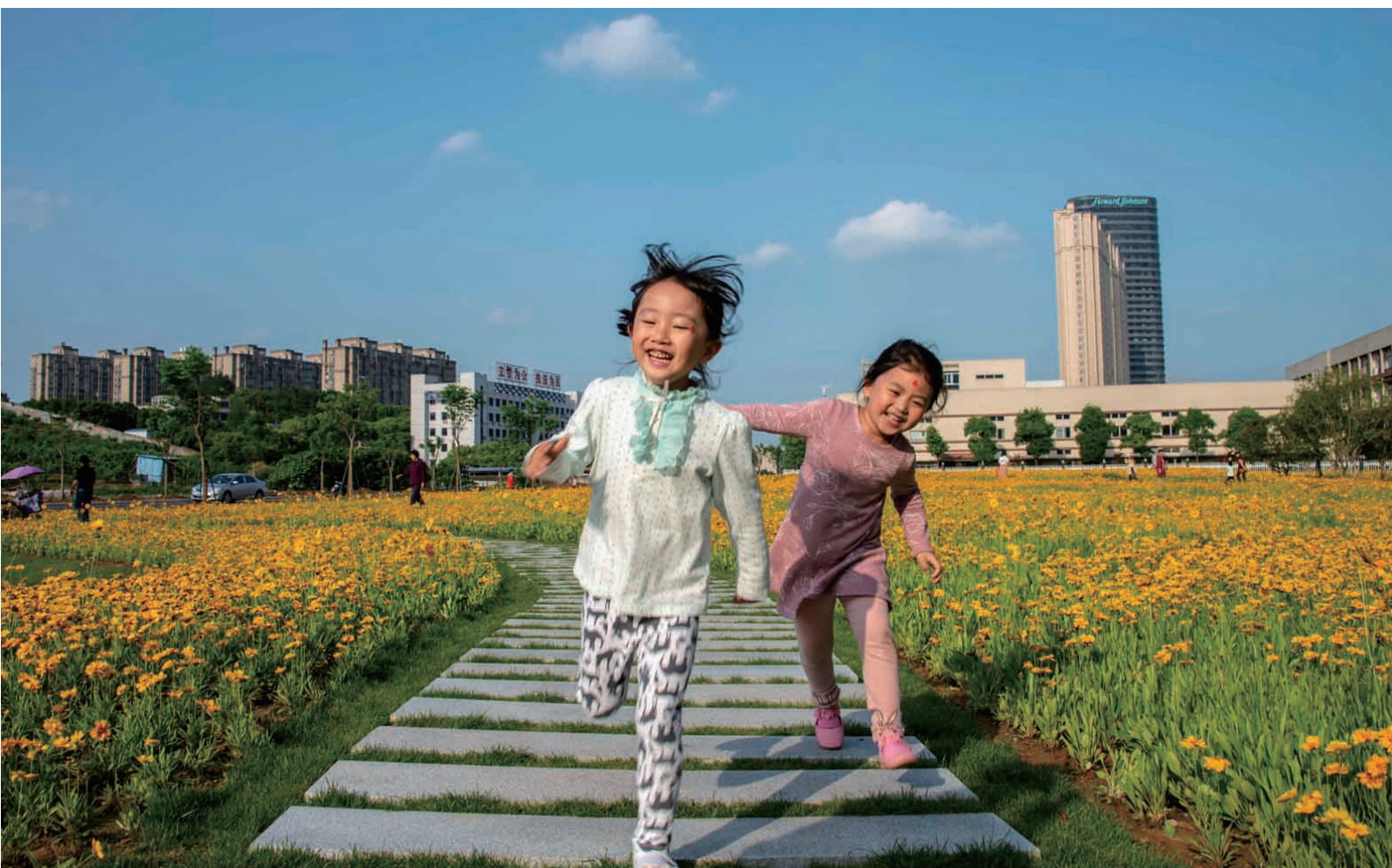
快乐小天使