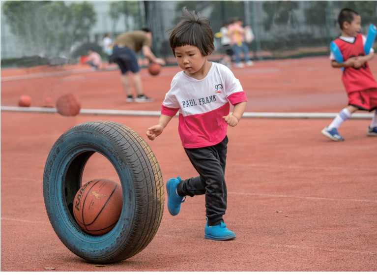
最爱的游戏