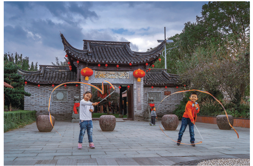
快乐童年