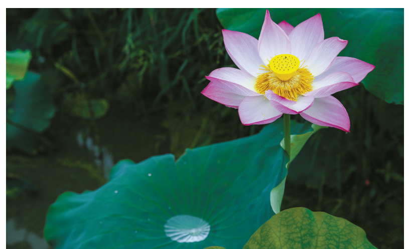
一枝独秀