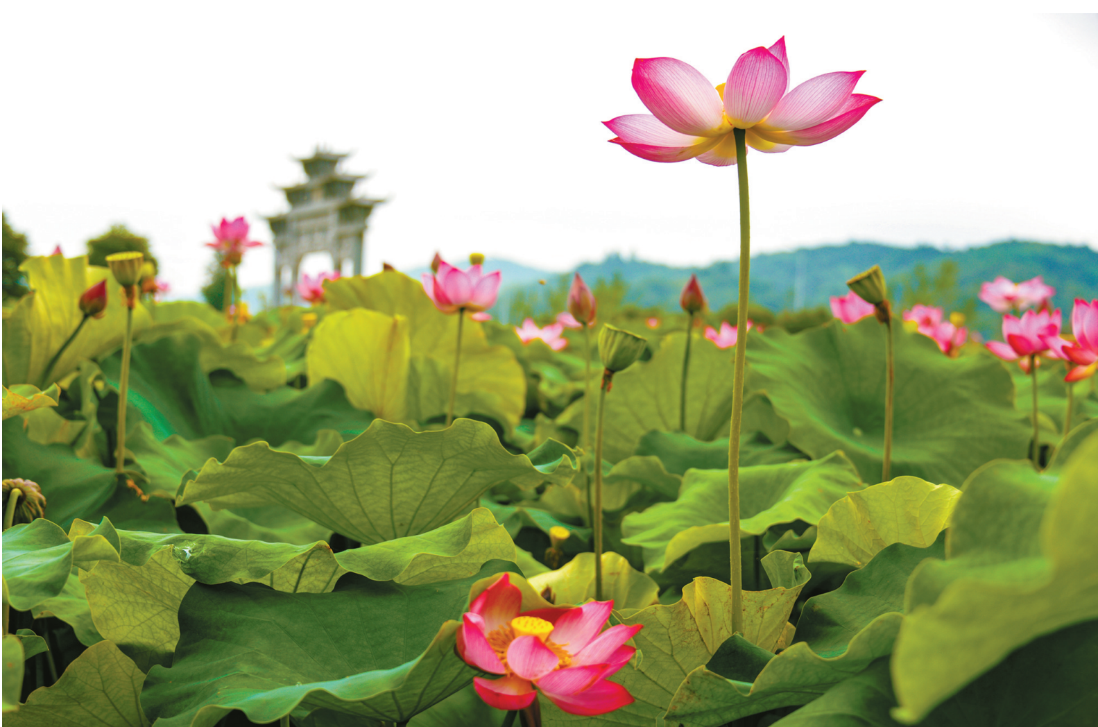
映日荷花别样红