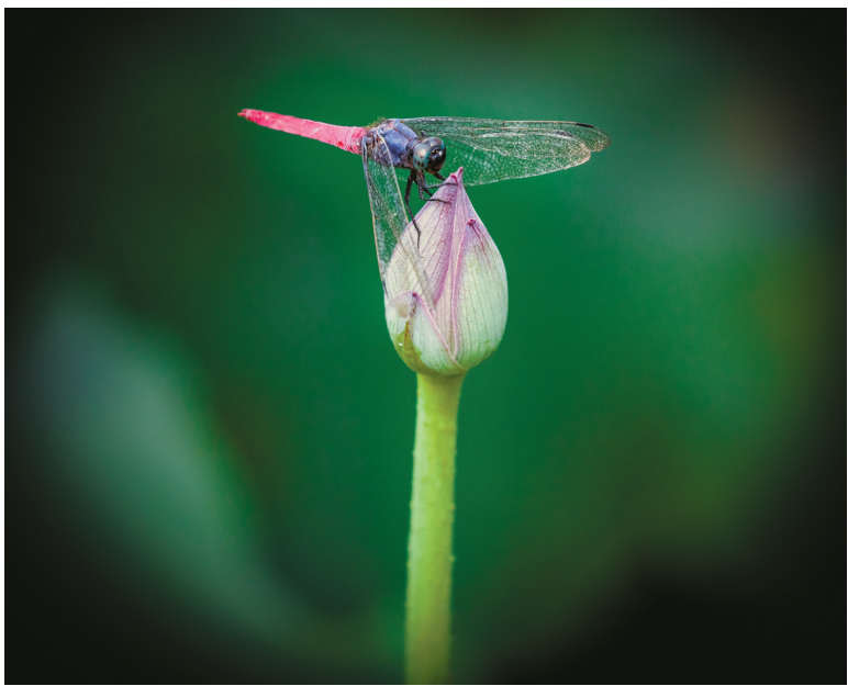
蜻蜓立上头