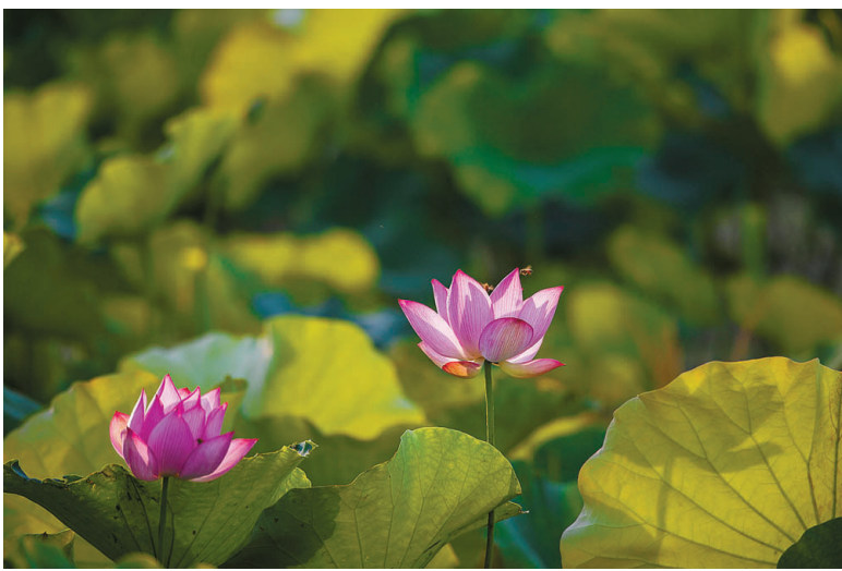
夏日荷趣