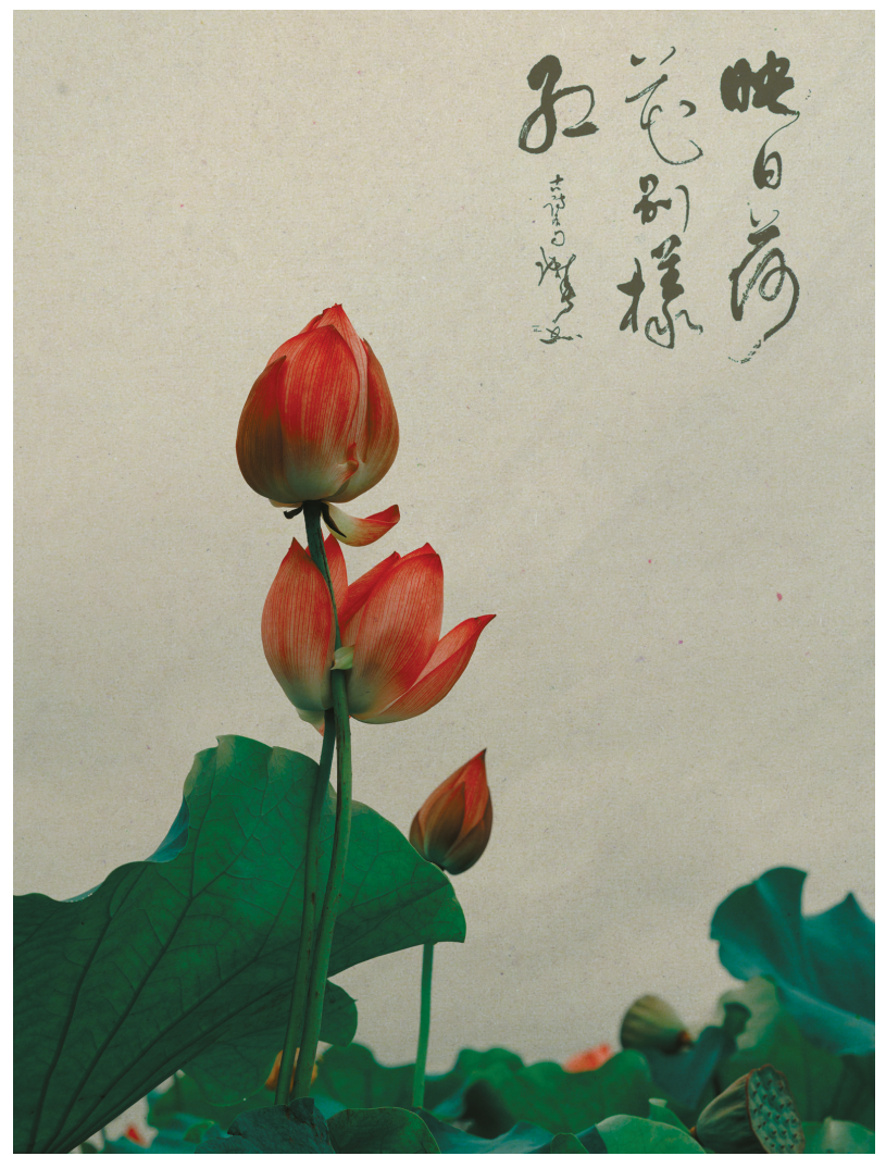
古风之荷韵