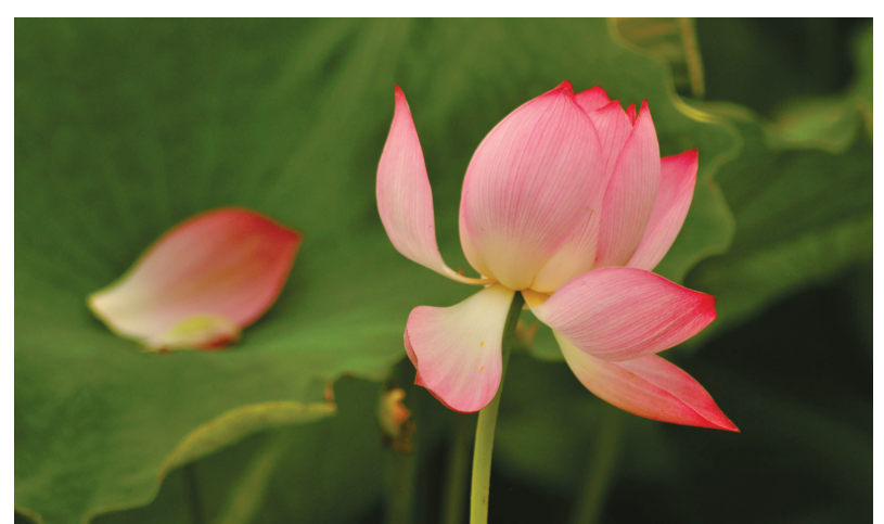
凋落之美