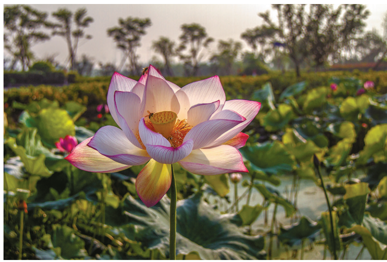
小蜜蜂采花