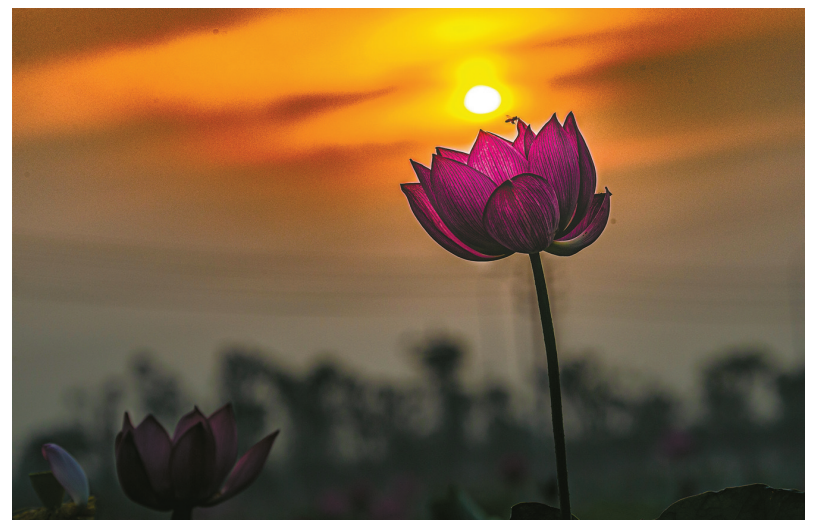
夕阳下的荷