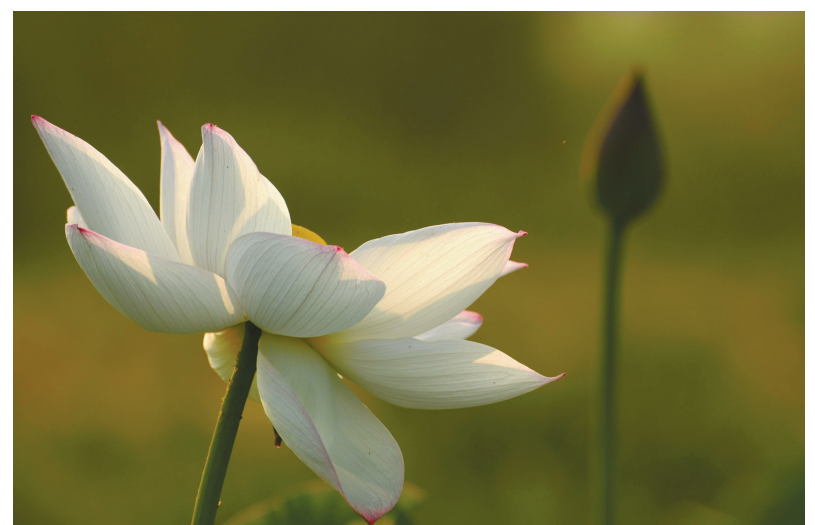
荷的遥望