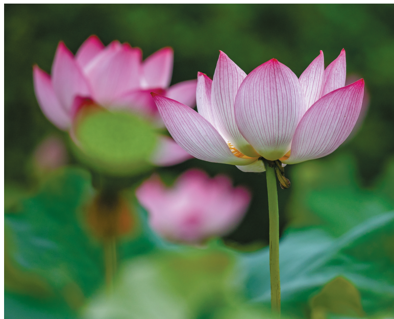
莲之秀丽