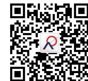
扫一扫,找工作不用愁!