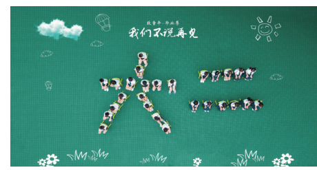
大二班我们毕业了