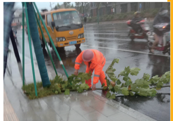
台风过后园林工人在扶正树木