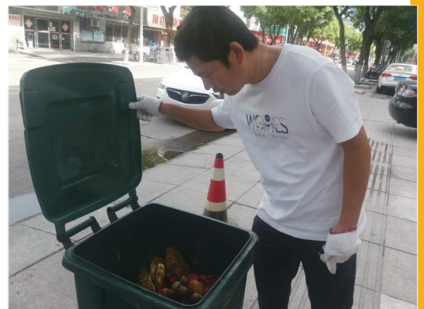
区环卫处垃圾分类考核员检查垃圾分类质量