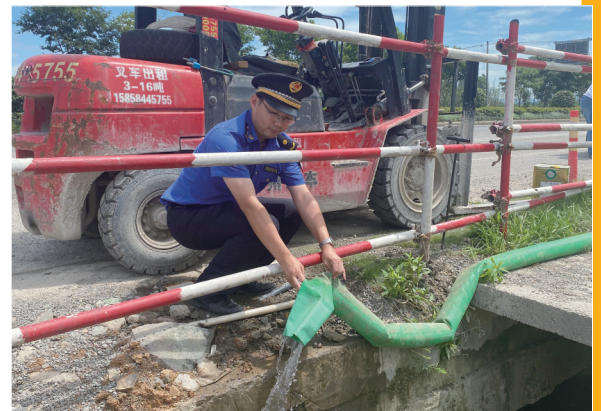
岳林中队开展工地排水执法检查

该局围绕顽疾点位,延伸乱象区域,对发现的问题实施清单列表、“组团”销号,着力解决一批市容顽疾。年初以来,累计开展各类综合整治420余次,纠正跨门经营、乱设摊、乱占道等“一跨十乱”行为4.1万余起,立案查处404起;抄告人行道违停车辆2.2万辆(次),规范非机动车停放1.2万辆。