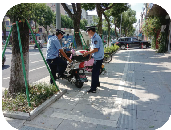
锦屏中队网格员规范人行道非机动车停放