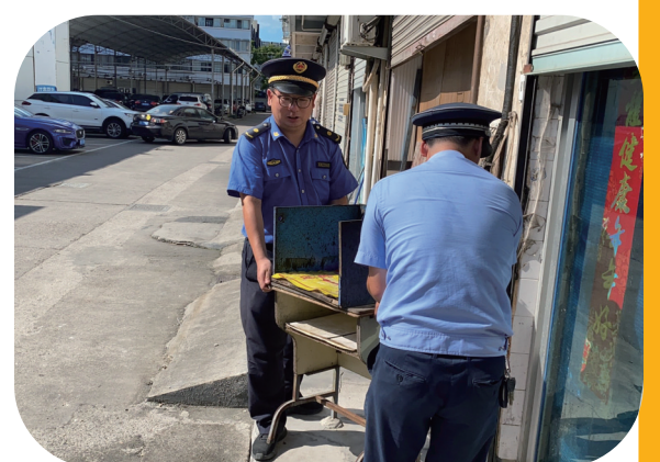
江口中队开展夏季市容专项整治