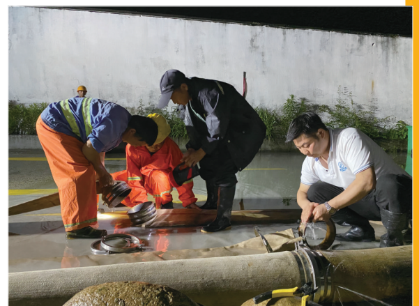
区排水处工作人员通宵抢排积水确保道路畅通

今年以来,该局紧盯垃圾分类城乡不平衡问题,坚持效果导向,采取“三破”突围(点长破局、政策破面、桶边破袋),引导机关干部参与垃圾分类志愿者活动,加大撤桶桶点、桶边督导力度,大力实施垃圾分类文明习惯养成行动,实现弯道超车、后来居上。