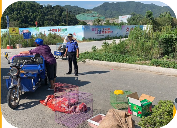
执法队员在烈日下开展占道经营执法

出梅以后,即迎来“三伏”,炎炎烈日炙烤着大地,滚滚热浪肆意袭人,全区进入“高温模式”。而此时,也是城市管理关键时节。为保持市容环境整洁、有序,区综合执法局的执法队员、城管工作者坚守岗位,接受高温“考验”。