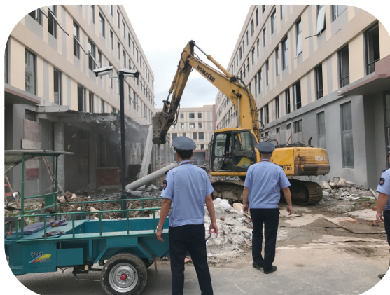
江口中队执法队员顶酷暑拆违